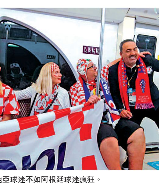
▲克羅地亞球迷不如阿根廷球迷瘋狂。

射手和助攻王，且平了歷史上的出場次數紀錄。他和隊友祖利安艾華利斯完美配合，許多入賽後翻出後者和美斯十幾年前的合影，似乎是另一種冥冥之中的命運安排。看來，世界盃有時候也是一種「玄學」。