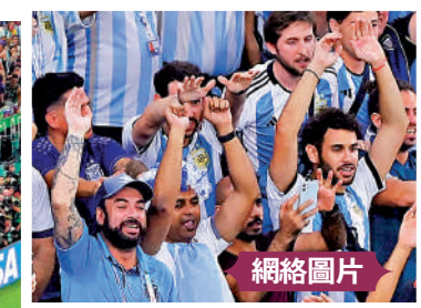
看台上過萬阿根廷球迷將美斯視為馬拉當拿之後另一個阿根廷救世主，賽後向他作出膜拜動作後另。