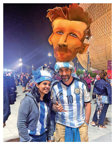
阿根廷球迷頂着巨大美斯頭像的裝飾，以示支持這名國英雄。

他亦慨嘆現今的球員越來越沒有個性，就像一個模子刻出來一樣，所以更珍惜能欣賞美斯比賽的機會：「你看現在的球員都沒有自己的風格，如果不是長得不一樣，我都分不清誰是誰。我想以後都不會出現像美斯這樣的球員，他已經35歲了，仍然可以交出令人驚訝的表現，就算我們最後拿不到冠軍，美斯毫無疑問仍是足球史上最棒的球員。」