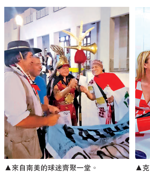
來自南美的球迷齊聚一堂。

一名帶孩子現場觀賽的父親告訴筆者，克羅地亞建國僅31年，已經兩次闖入8強，無論賽果如何，已經是教育後代努力為國爭光的最好教材。