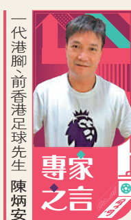
代筆師前香港足球先鋒陳炳安