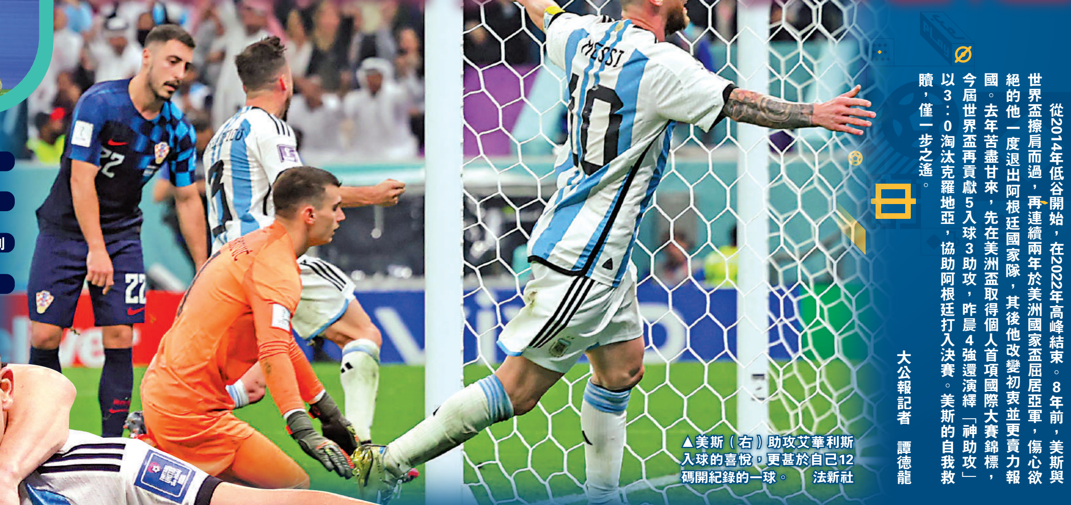
美斯（右）助攻艾華利斯入球，美斯（左）接應攻入第3球後擁抱祝捷。