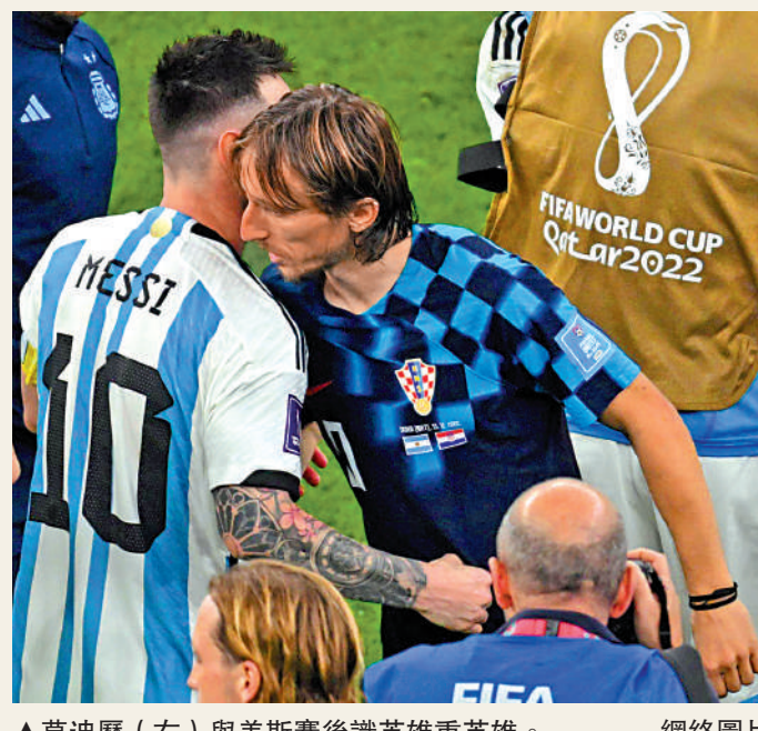
▲莫迪歷（右）與美斯賽後識英雄重英雄。

【大公報訊】據ESPN FC報導：4年前的「魔笛」莫迪歷表現八面玲瓏，4年後已年屆37歲的他，依然活力四射有巔峰演出，可惜今次未能再度帶領克羅地亞進入決賽。莫迪歷祝願美斯最終能高舉世盃盃盃，但未透露是否在世盃後引退，教練連歷則希望他繼續踢至2024年歐洲國家盃。