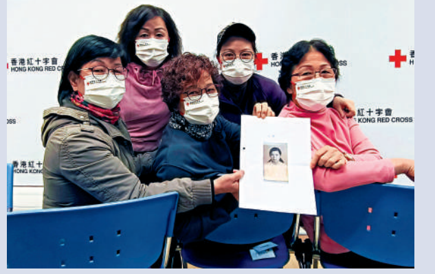
▲幾位姊妹現也已年過六旬，希望冬至前一家人再團聚，還父母遺願。