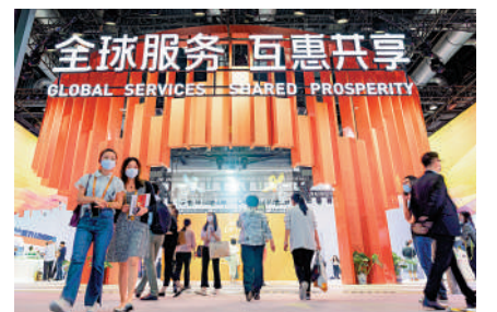
▲觀眾在參觀2022年中國服貿會中國服務貿易成就展專區。

「集中精力把自己的事情辦好，不管風雲變幻，無論風吹浪打，我自巋然不動。」克服千難萬險、走過千山萬水，我們更加堅信，有以習近平同志為核心的黨中央堅強領導，有習近平新時代中國特色社會主義思想科學指引，有14億多中國人民團結奮鬥，鏗定奮鬥目標，用好有利條件，激發奮鬥豪情，中國經濟航船定能越過激流險灘、穿過驚濤駭浪，駛向更加壯闊的前程！