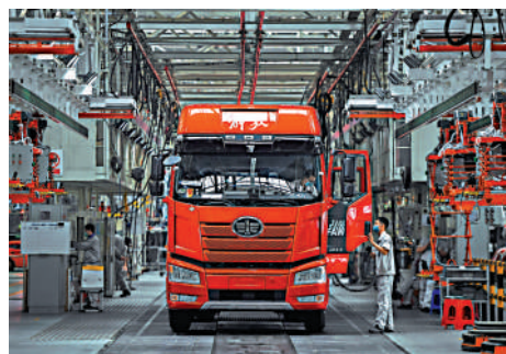
▲2022年6月15日，工人在位於吉林長春的一汽解放總裝車間內裝配車輛。

如何解決快速發展積累的老問題，如何迎接轉型升級的新挑戰，發展千頭萬緒！「堅持以人民為中心的發展思想」「着力解決發展不平衡不充分問題」「堅持新發展理念」「推動經濟發展質量變革、效率變革、動力變革」「構建新發展格局」「統籌發展和安全」……習近平經濟思想系統回答了新時代中國經濟「怎麼看」「怎麼幹」等重大理論和實踐問題，指引我國經濟於紛繁複雜中開闢坦途。實踐證明，回答時代課題，黨的思想引領力「不斷開闢發展新境界」。只要深入學習貫徹習近平