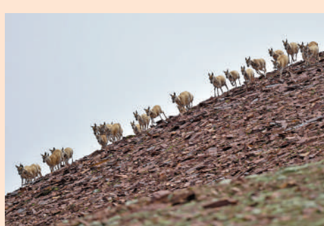
▲在可可西里卓乃湖區域，一群藏羚羊在奔跑。

●中國是全球森林資源增長最多和人工造林面積最大的國家，成為全球「增綠」的主力軍。