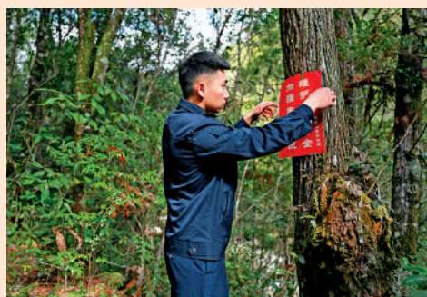
▲1月19日，武夷山國家公園護林員在固定加強生態建設的宣傳牌。