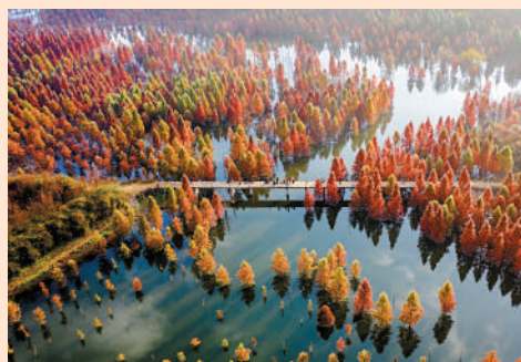
▲雲南省昆明市的甸尾村水杉濕地一景。