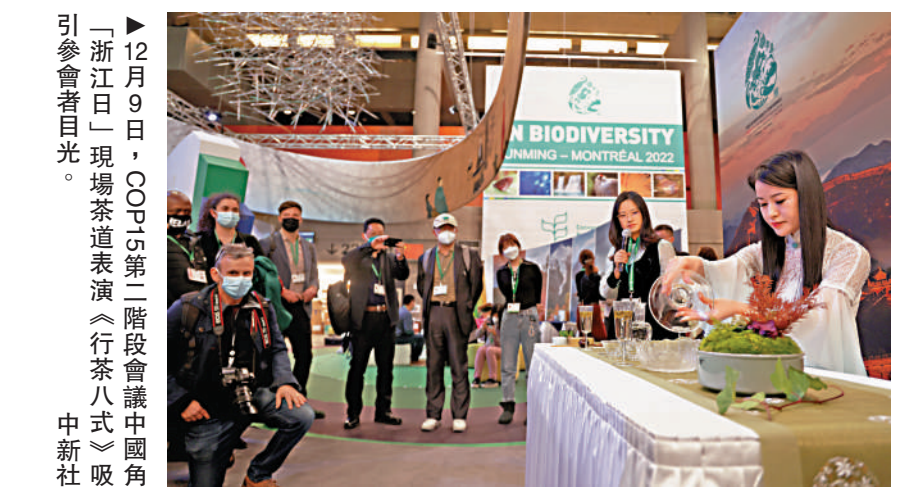
▶12月9日，COP15第二階段會議中國角「浙江日」現場茶道表演《行茶八式》吸引參會者目光。

12月12日，在COP15一場記者會上回答媒體提問時，穆雷瑪表示，中國是本次大會主席國，因此發揮了引領作用，且大家看到了「良好的引領」。她表示，自己仍很樂觀，期待在COP15第二階段計劃結束的12月19日午夜之前達成協議。