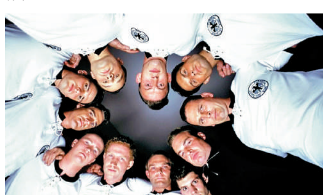
▲《伯爾尼的奇跡》呈現團隊視角，眾人最終取得勝利。

廣受歡迎的足球電影很多，其中具有代表性的包括美國電影《一球成名》(Goal!)和德國電影《伯爾尼的奇跡》(Das Wunder Von Bern)。