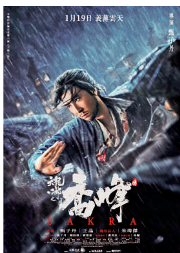
▲《天龍八部之喬峰傳》電影海報。

由甄子丹監製、導演及主演的《天龍八部之喬峰傳》，將於2023年1月19日農曆新年前上映。金庸的《天龍八部》是家喻戶曉的作品，過去多次被改編成電視劇及電影作品，今次甄子丹將《天龍八部》喬峰部分的故事改編搬上大銀幕，期許為武俠電影翻開新篇章。