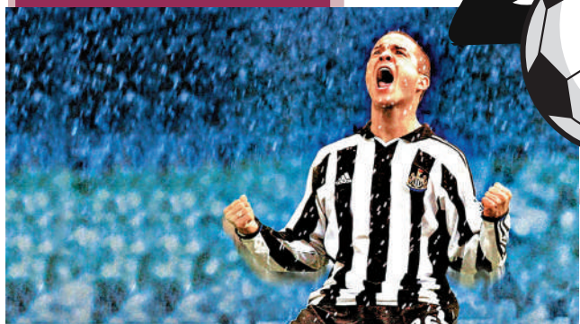
▲《一球成名》講述主角歷經磨練終於加入英超球隊。