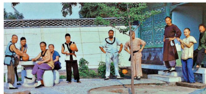
《京都球俠》中的周天(右三)組隊與外國球隊對戰。

就用《京都球俠》中主角形容足球的一句話來作為這篇文章的結尾吧——「這，既是兒戲，又是較量。」