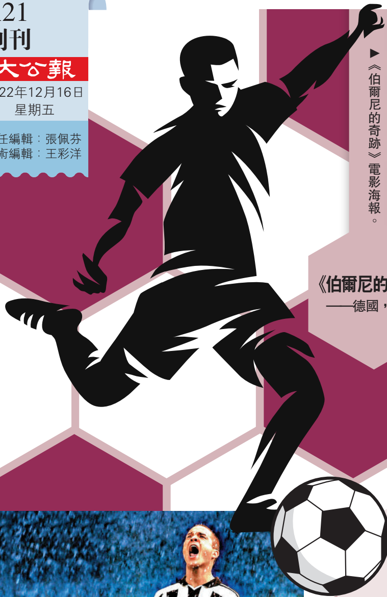
《伯爾尼的奇跡》電影海報。