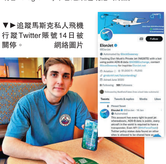
▼追蹤馬斯克私人飛機行蹤Twitter賬號14日被關閉。

現Twitter全面支持言論自由。但是，Twitter近日卻更新其隱私政策，要求用戶必須經過當事人同意，才能分享圖片、影片或是其他個人資訊。