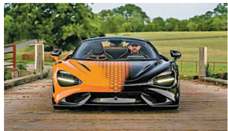
▲涉案網紅馬特洛克在社交媒體上發布豪華車照片，聲稱為投資所得。