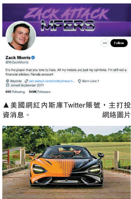
▲美國網紅內斯庫Twitter賬號，主打投資消息。

【大公報訊】綜合路透社、彭博社、華爾街日報報導：美國證券交易委員會（SEC）14日起訴八名網紅，他們涉嫌通過社交媒體平台操縱股價，涉案金額高達1.4億美元（約38億港元）。被告在社交媒體上向粉絲炒作特定股票，並在粉絲買入、股價上漲時即刻拋售股票而牟利。這些人同時被美國司法部起訴，最高可面臨25年刑期。