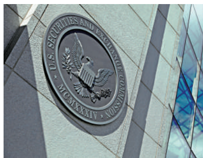
▲美國證券交易委員會14日起訴八名網紅，他們涉嫌透過社交媒體操縱股價。

美國證交會主席根斯勒此前專門在Twitter上發文並拍攝短片，呼籲投資者勿輕易相信名人或意見領袖（KOL），他們在電視或社交媒體打廣告的投資機會，不代表適合所有投資者。美證交會本周三也提出了增強透明度和競爭性規則的方案，以回應「Meme股」熱潮暴露出的諸多監管問題。