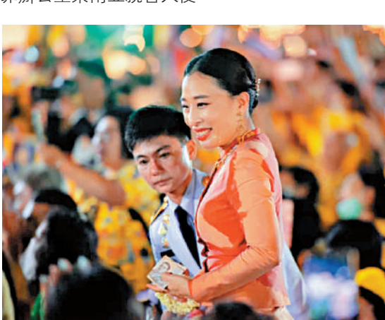
▲泰國長公主帕查拉吉迪雅帕14日在訓練狗隻時，因心臟問題失去意識。

哇集拉隆功一直未宣布男性儲君，帕查拉吉迪雅帕公主一度被外界認為是王位接班人。帕查拉吉迪雅帕從美國康奈爾大學取得法學碩士和博士學位，曾擔任過泰國駐奧地利大使、聯合國毒品犯罪辦公室東南亞親善大使。