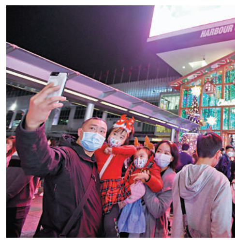
◀有調查顯示,受訪的63%男士和57%女士,預期聖誕消費較上年增加。