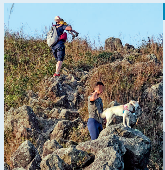
▲男子全身沒有任何防護裝備,就向上爬行。