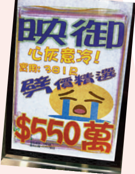
▲多區地產舖貼出別具創意的賣樓標語。