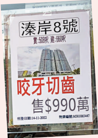
▲大圍有地產舖貼出「咬牙切齒」的賣樓標語。