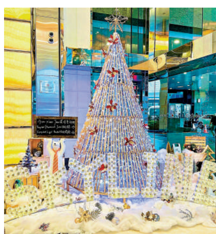
▲信和置業再度舉辦「升級再造聖誕樹活動」。

的物料皆別具心思、充滿創意。我們每年都有很多的慶祝活動，希望大家能夠發揮想像與創新，與親朋好友一同感受節日氣氛之餘，亦能夠傳遞可持續發展概念。