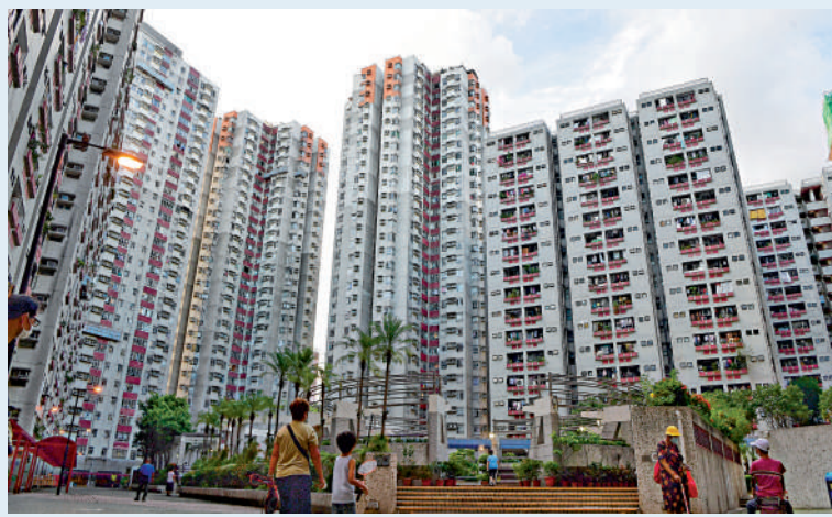
▲新一批「白居二」大軍入市帶動下，二手資助房成交大增。