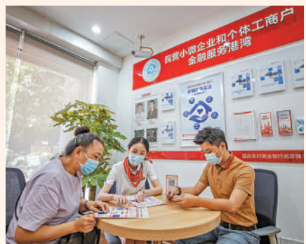
▲多地推出普惠金融服務助力企業紓困解難。圖為重慶一金融工作人員為商戶介紹相關貸款政策。

會議指出，要全面推進鄉村振興，堅決防止出現規模性返貧。謀劃新一輪全面深化改革。推動共建「一帶一路」高質量發展。深入實施區域重大戰略和區域協調發展戰略。要推動經濟社會發展綠色轉型，協同推進降碳、減污、擴綠、增長，建設美麗中國。會議強調，對於我們這麼大的經濟體而言，保持經濟平穩運行至關重要。要着力穩增長穩就業穩物價，保持經濟運行在合理區間。