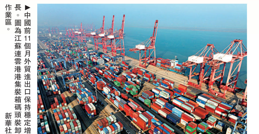
長業區。圖為江蘇連雲港港集裝箱碼頭裝卸作業區。圖為前11個月外貿進出口保持穩定增長。

國家信息中心首席經濟師祝寶良指出，疫後復甦，由於疫情不確定性，接觸性、場景性消費受限，旅遊、住宿餐飲、交通出行、文娛等消費需求始終難以釋放；居民收入下降，居民儲蓄傾向明顯上升，消費能力減弱，消費信心不足。在此背景下，中央經濟工作會議提出恢復和擴大消費需求。近日中央發布擴大內需戰略規劃綱要，提出全面促進消費，都預示着明年將有大動作大政策。