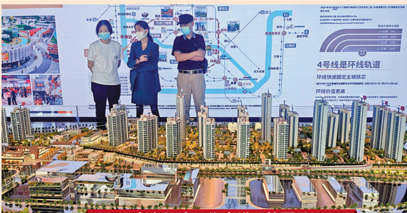
中央經濟工作會議政策要點