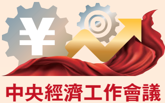
中央經濟工作會議

中央經濟工作會議12月15日至16日在北京舉行。中共中央總書記、國家主席、中央軍委主席習近平出席會議並發表重要講話。李克強、李強、趙樂際、王滬寧、韓正、蔡奇、丁薛祥、李希出席會議。對於明年經濟工作，會議提出，有效防範化解重大經濟金融風險。要確保房地產市場平穩發展，扎实做好保交樓、保民生、保穩定各項工作，滿足行業合理融資需求，推動行業重組併購，有效防範化解優質頭部房企風險，改善資產負債狀況，同時要堅決依法打擊違法犯罪行為。要堅持房子是用來住的、不是用來炒的定位，推動房地產向新發展模式平穩過渡。