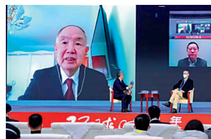
▲海軍少將楊毅在環球時報2023年會上發言。

楊毅認為，中美兩國是「志不同道不合」，但不得不跟對方打交道。什麼叫「志不同」？就是中國主張構建人類命運共同體，而美國試圖維持和強化它的全球霸權地位，「道不合」就是中國主張不衝突、不對抗，相互尊重，合作共贏。而美國堅持從實力、地位出發，與中國進行競爭。