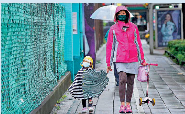
寒流殺到 寒流殺到，台灣持續發布低溫特報，12月17日傍晚起至19日清晨，各地天氣寒冷，會有攝氏10度以下氣溫，民眾外出時紛紛穿上厚重衣物禦寒。

此外，簡錦漢指出，如果美國持續加息，台灣的利率水準不能差太遠，否則利差因素將導致資金外流、新台幣貶值，並加劇輸入性通脹。