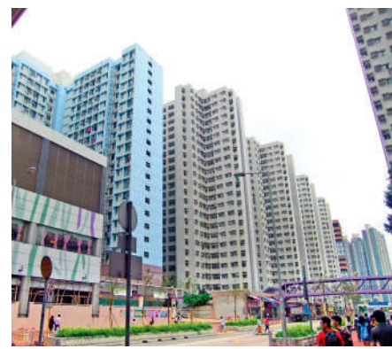
▲富榮花園身價隨大呎市大插水。

市場消息指，曾威風一時呎價貴絕新界的將軍澳寶明苑，一伙納米戶險守300萬關口，較4年前蒸發兩成。有關單位為A座寶松閣低層1室，實用面積213方呎，開放式間隔，原叫價330萬元，已低於購入價，最新減價30萬元或