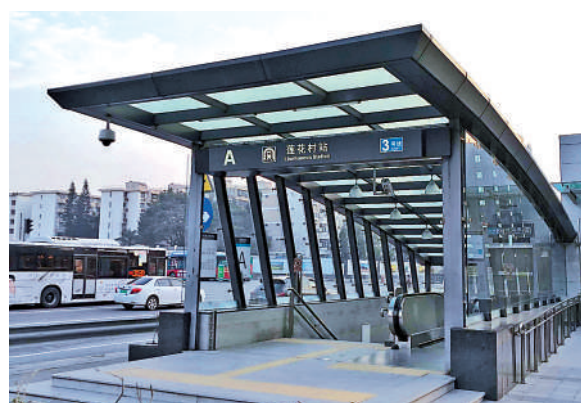
▲蓮花村站是深圳地鐵3號線和10號線交匯站，4站直達福田口岸。

深圳福田區蓮花片區緊鄰福田中心，地鐵3號線、4號線和10號線在蓮花村和少年宮交匯，由蓮花村站僅4站直達福田口岸，兩站到地鐵站極其方便。蓮花片區擁有中心書城、圖書館、博物館、音樂廳等文化地標，同時緊鄰蓮花山、筆架山和中心公園，環境優美，多年來吸引不少港人置業。片區內的蓮花村樓齡雖逾30年，但上車容易，有不少港人擇居，其中優勢最為明顯的蓮花二村，42平米一房一廳小戶型售價約8.6萬元（人民幣，下同），便可以享受成熟的生活、文化和交通等配套。