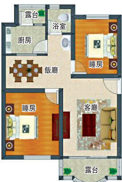
▲蓮花二村76平米兩房兩廳戶型圖。