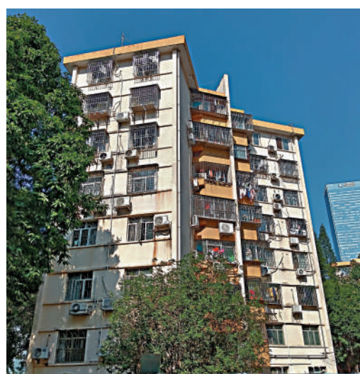
▲蓮花二村樓層不高，居住密度較低。