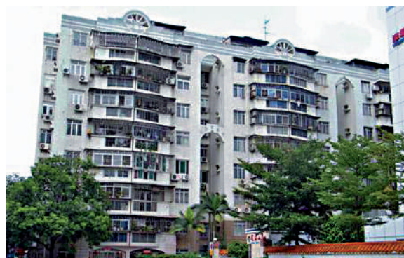
▲蓮花三村由多幢物業組成，提供2681伙。