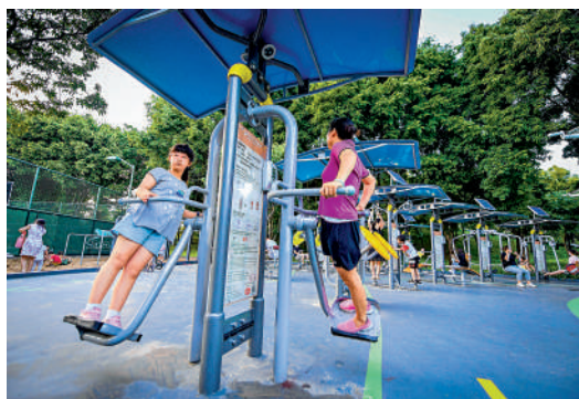
▲中心公園是當地居民的休閒好去處。