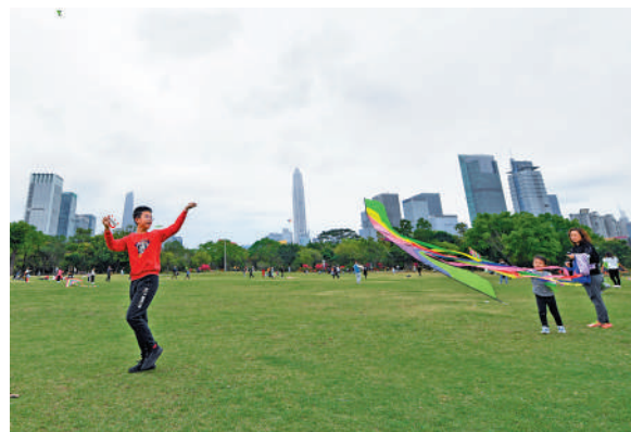
▲蓮花山公園位於深圳市中心，位置優越，每逢假日有不少市民玩樂。