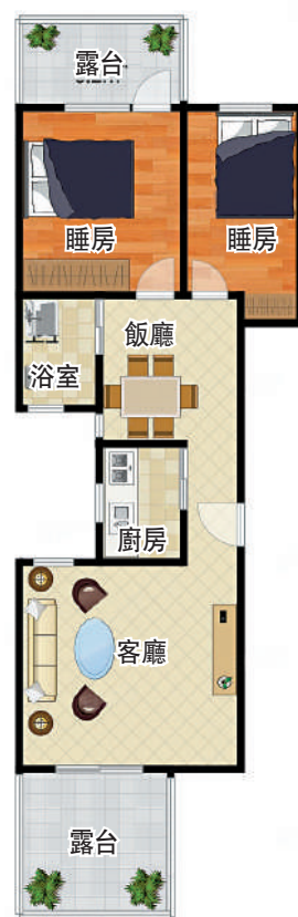
▲蓮花三村78平米兩房兩廳戶型圖。

現在，蓮花三村單位市場價為每平米9萬元（人民幣，下同），政府指導價為每平米8.3萬元。