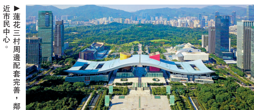
▲蓮花三村周邊配套完善，鄰近市民中心。