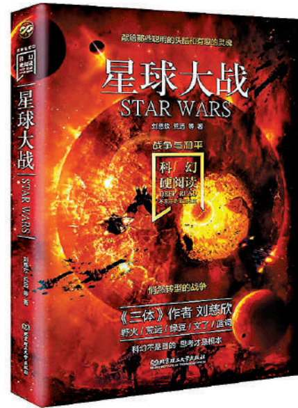
▲《科幻硬閱讀——星球大戰》集合中國科幻老、中、青三代名家經典作品，代表着中國科幻目前的整體水準，在閱讀過程中，更能引發讀者對於未來的想像和思考。

建設航天強國是中華民族實現偉大復興的重要支撐，未來中國人登上月球已經不再是夢想。以神舟十五號升空為新的起點，在新時代新征程上，中國航天員正在繼續奮鬥，中國空間站即將啟幕無限未來，讓中國硬科幻為中華民族軟實力增光添彩，讓我們共同譜寫更加偉大、更加恢弘的嶄新篇章！