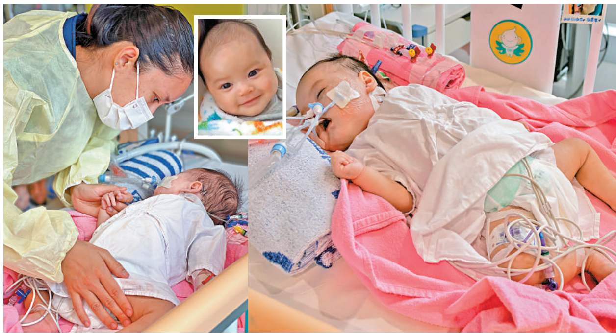
▲在兩地24部門「愛心接力」下，四個月大的芷希成功換心，現時在兒童醫院深切治療部留醫。

國家衛健委醫療應急司司長郭燕紅接受新華社訪問表示，黨中央、國務院高度重視器官捐獻與移植事業，經過長期不懈努力，我國器官捐獻和移植數量大幅提升，器官移植的質量和技術能力也在不斷提升。