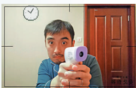
▲線上戲劇《等待戈多》2.0版劇照。