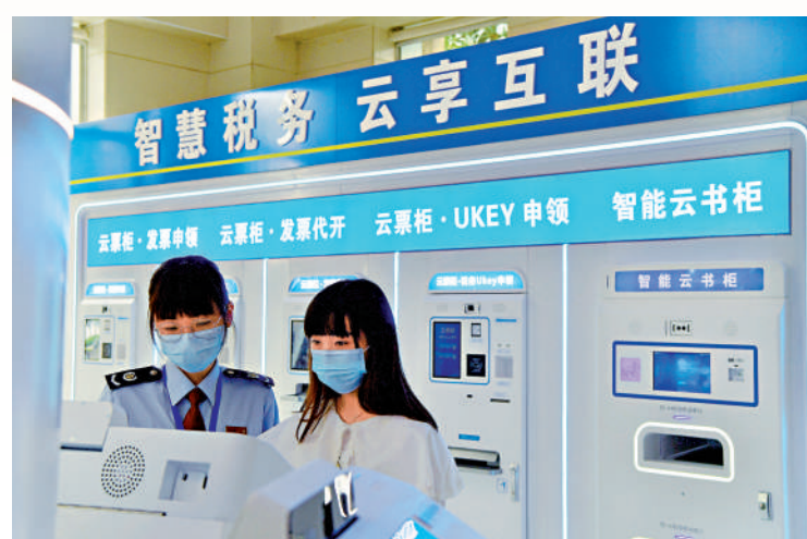
▲福建一企業工作人員在稅務局辦理涉稅業務。

韋伯爾還告訴大公報，當地政府對企業支持力度較大，三年前就批下了一塊工業用地，並幫助推進審核流程，新生產線在辦理建築執照、安全許可證、消防許可證等事情上，也都進展很順利。但過去三年，也面臨人員交流等障礙，希望隨着防疫政策變化，明年得到改善。