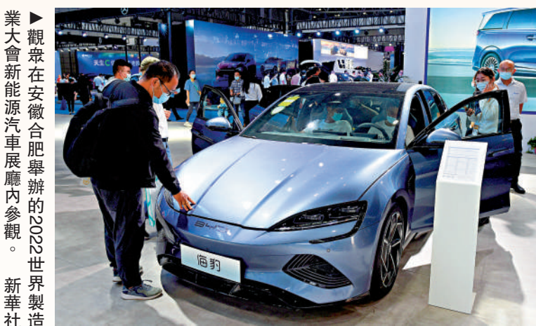
▲觀者在安徽合肥舉行的2022世界製造業大會新能源汽車展廳內參觀。

羅志恆還指出，要進一步提高財政支出中教育、養老、醫療等社比的比重，解決居民的後顧之憂，減少預防性儲蓄。加快戶籍制度改革，加快推進農民市民化進程，穩定農民工預期，提高邊際消費傾向。此外，從供給端發力，提升中高端產品的供給，提高產品質量，促進大量的海外購物和奢侈品消費回流本土市場，滿足中高收入者的需求，同時促進消費和產業結構升級。另外，放寬旅遊、文化、醫療、養老、教育培訓和家政服務等服務消費領域的市場准入，鼓勵民營及外資機構參與競爭。