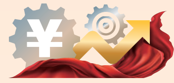
解讀中央經濟工作會議

中央經濟工作會議對2023年中國經濟發展作出最新擘畫，「擴內需」重要性進一步突顯。會議公報表示「明年經濟工作千頭萬緒，要從戰略全局出發，從改善社會心理預期、提振發展信心入手，綱舉目張做好工作」，而「綱舉目張」的五項工作中首要任務就是「着力擴大國內需求」。專家表示，下一步擴大內需在於促進消費，才能激活經濟內生動力。提振消費必須依靠改革，政策最終落腳點要提高居民收入。穩消費，主要穩市場主體，穩住一家小商小販，就穩住幾家人的生計。