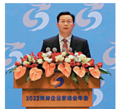
▲國台辦副主任潘賢掌呼籲台商要抓住大陸的發展機遇。

潘賢掌說，兩岸同胞是一家人。兩岸經貿合作符合市場規律。10年來大陸一直是台灣最大的出口市場、最大的島外投資目的地和最主要的貿易順差來源。10年來兩岸貿易額翻了一番，台商在大陸投資項目增加近49%，強力拉動台灣經濟發展。「今年1-11月，兩岸貿易額達2945億美元，給台灣帶去約1438億美元巨額貿易順差。歷史和現實都深刻昭示兩岸經濟密不可分，脫不了鉤斷不了鏈，唯有加強合作才是人間正道，才能造福兩岸同胞，台灣經濟發展、民生改善才有更大確定性和更堅實的依靠。」