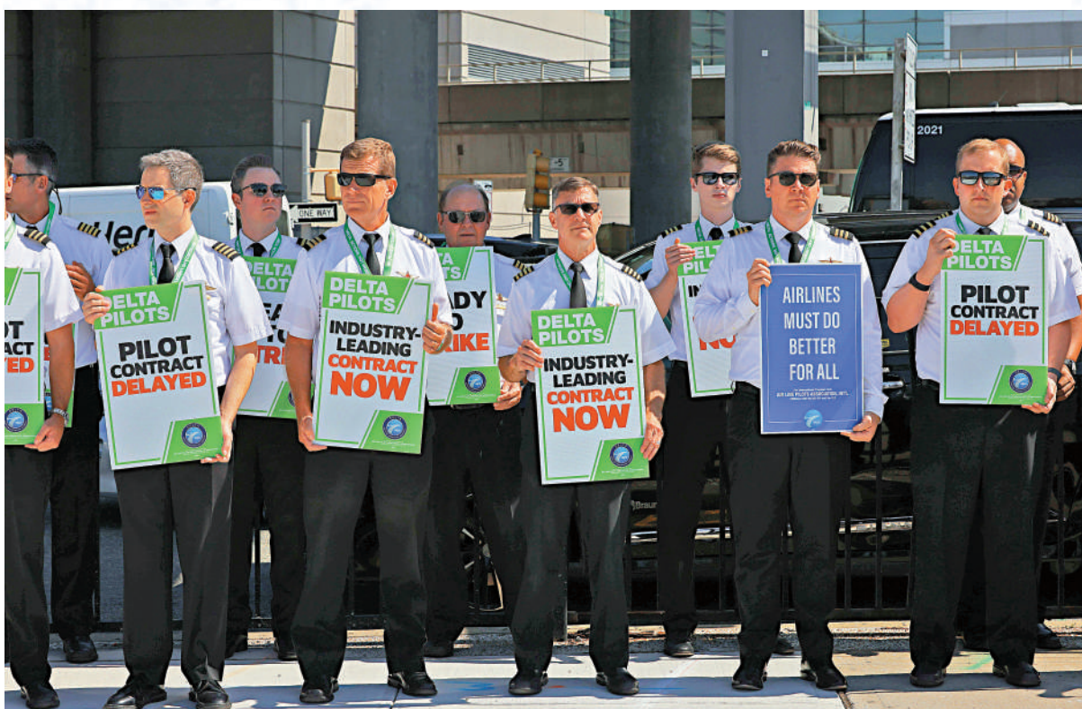
▲受新冠疫情影響，美國航空業人手緊張，圖為達美航空機師9月舉行示威活動。