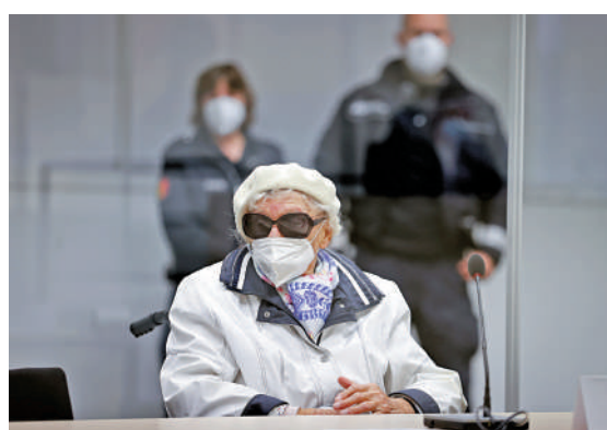
▲97歲的前納粹秘書被指在集中營內參與殺害逾萬人。

檢察官Maxi Wantzen表示，此次審判具有突出的歷史意義，「隨着時間的流逝，這可能是同類案件中的最後一場審判。」2011年一名前納粹警衛首次因擔任營地看守而被定罪，開創法律先例。