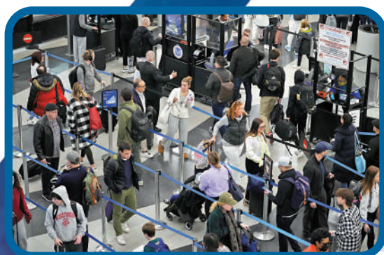
▲有乘客表示不會乘坐單人駕駛的飛機，圖為芝加哥奧黑爾國際機場大廳。

去年起，達美航空、美聯航和西南航空等公司的機師頻頻發起示威，指控公司安排工作過量導致人力疲勞。今年7月，北歐航空公司因機師罷工導致財務緊張，在美國申請破產保護。