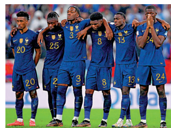
▲法國隊輸球後，多名非裔球員遭遇種族主義者的網絡暴力。

族主義言論的攻擊。在去年的歐洲國家盃決賽後，英格蘭隊拉舒福特、查頓辛祖和布卡約沙卡三位球員，也因為在對戰意大利隊中的點球失利而遭到網民的種族主義留言攻擊。