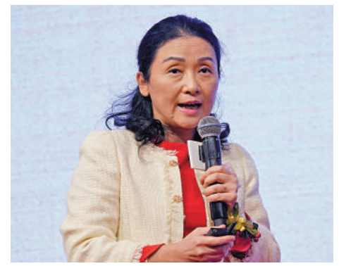
▲彭博亞太區首席經濟學家舒暢表示，走出疫情是中國經濟最大的亮點，可以為經濟帶來1.6個百分點拉升。