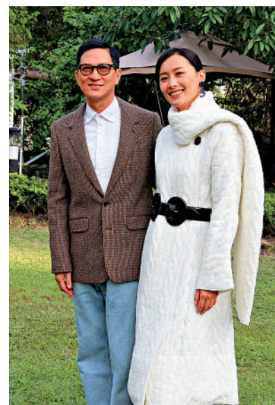
▲張家輝（左）與陳法拉出席新片開鏡儀式。

子。袁富華快將小登科，但婚期未定；他笑指現在看看是否會有人反對婚事，希望沒有。袁富華續說因為忙拍戲，現在結婚日子未定；笑指另一半腳頭好，最近自己接了不少工作。