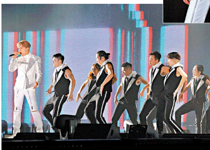
▲張敬軒感謝歌迷對他的支持。