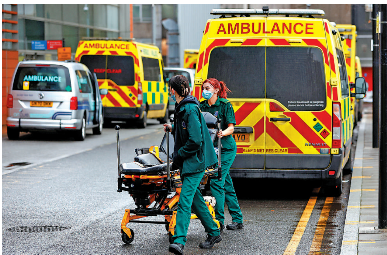
▲英國急救人員21日罷工，倫敦街頭的救護車數量驟減。

BBC指出，新冠疫情期間英國醫療系統壓力巨大，救護車遲到問題已非常嚴重，罷工無疑是雪上加霜。英格蘭東北救護服務機構表示，21日罷工前夕，其服務範圍內超過200名患者遇到救護車嚴重