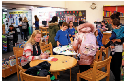
▲英國民眾14日拖家帶口前往庇護所取暖。

2月24日俄烏衝突爆發以來，西方國家對俄羅斯施加多輪嚴厲制裁，包括限制或禁止進口俄羅斯能源。但制裁的同時，也導致依賴俄羅斯能源的歐洲物價飛漲、民眾生活開支激增。10月起，英國一般家庭能源費用上限飆升80%至3549英鎊，即便政府提供電費補貼也只是杯水車薪。