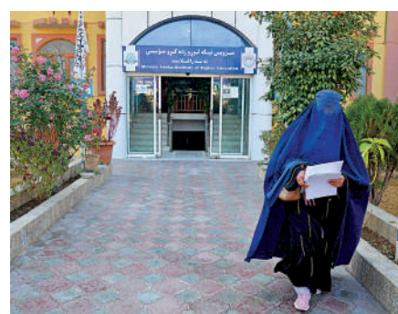
▲阿富汗女性21日被攔在大學校園外。

阿富汗臨時政府高等教育部發言人證實，該部門已向阿富汗私立與公立大學發送信函，要求其暫停招收女學生。21日，數百名阿富汗年輕女性被持槍警衛攔在大學校園外。據報道，阿富汗女性不久前剛參加完高中