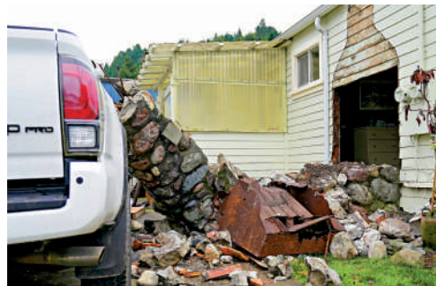
▲加州洪堡縣里奧戴爾的民宅20日在地震中受損。