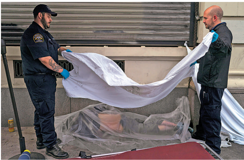
▲洛杉磯街頭一名流浪漢吸毒致死，法醫及調查員正在處理其屍體。