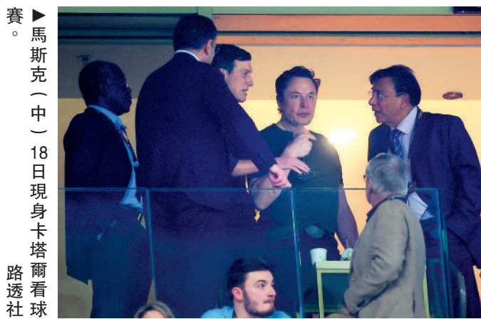
▲馬斯克（中）18日現身卡塔爾看球賽。

【大公報訊】綜合CNN、路透社報道：推特（Twitter）行政總裁馬斯克在社交平台Twitter發文稱，一旦找到繼任者，將辭任Twitter行政總裁一職。