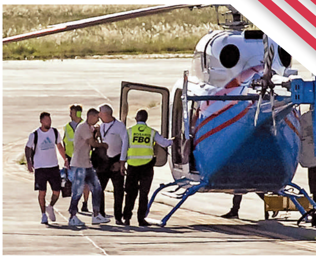
▲有球迷為了一睹冠軍球隊的風采，攀爬至高處。