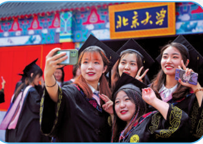
北京大學注重開拓學生的學術視野，為中國心理學培養了一大批頂尖科研人才。