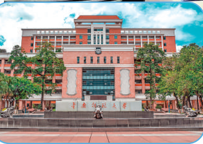
華南師範大學心理系科研成績突出，在2013至2017年間，以第一完成單位獲得省部級以上科研獎勵12項。