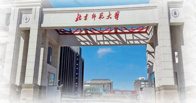
北京師範大學心理學專業在軟科2022中國大學排名第1位。