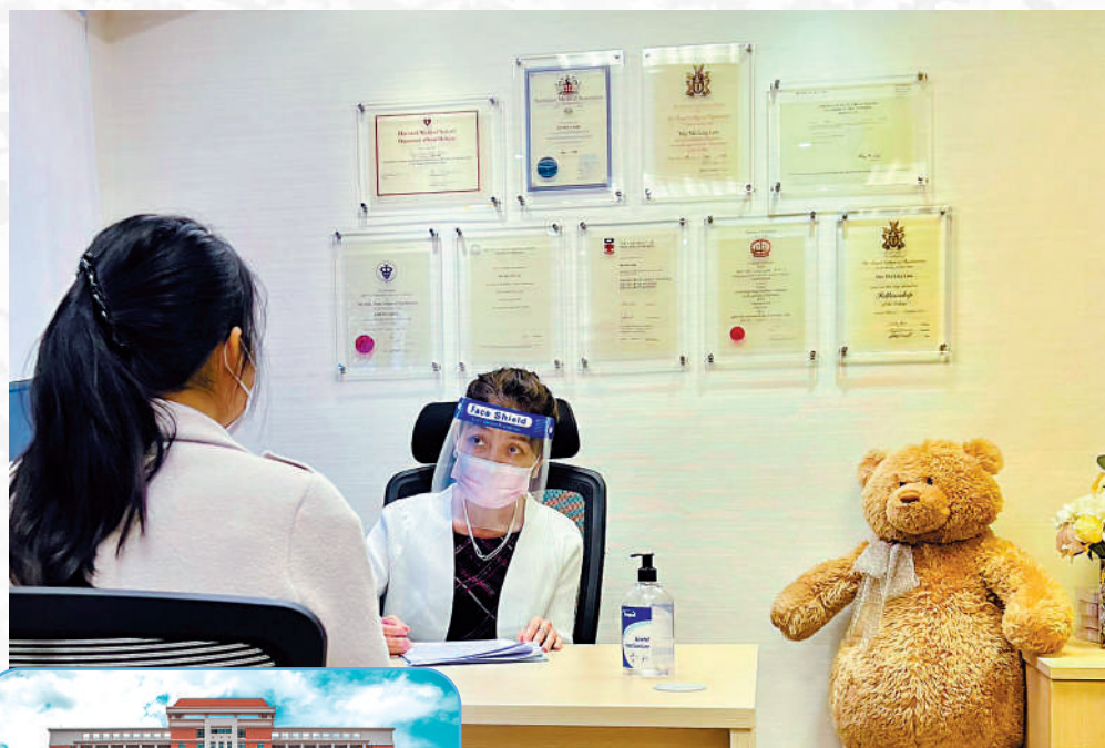
政府機構提供的臨床心理治療服務不足以應付需求，不少市民因輪候時間過長，要向私家心理醫生求診。