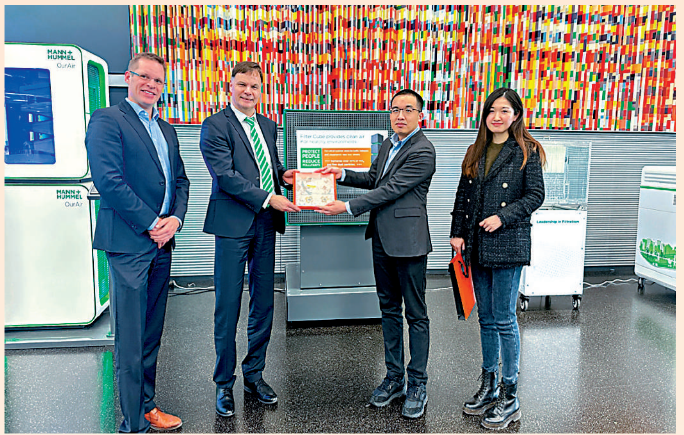
▲近期內地各省市掀起了一陣組團出境招商引資的風潮。圖為昆山開發區招商小分隊拜訪曼胡默爾德國路德維希堡總部。

「築巢引鳳，花開蝶自來。」他說，國家之間抑或地域之間的競爭，誰能提供更好的投資營商環境，誰就能吸引更多的資源，誰就能夠贏得市場發展的先機，掌握發展的主動權。因此，當務之急是要從「抓項目」轉向「造環境」，它會對一個地區乃至國家的發展產生深遠影響。