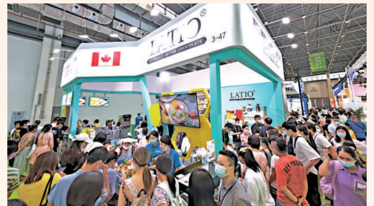
▲7月30日，觀衆在海南海口的消費市場選購加拿大巧克力。

和精準銜接度。借鑒蘇州「政策計算器」的辦法，通過「互聯網+企業服務」，變「企業找政策」為「政策找企業」。運用大數據算法和人工智能技術，將企業信息和政策信息進行匹配計算，並自動推送給企業，讓企業第一時間獲取政策，提高企業政策申報效率，解決企業服務領域存在的涉企優惠政策尋找繁、專業服務尋找難、企業投訴途徑少等問題，打通政策服務的「最後一公里」，營造更加穩定公開透明、可預期的投資營商環境。劉志彪還認為應該鼓勵引導外資企業實施利潤再投資，進一步挖掘釋放外資投資潛力，從資金支持、涉稅服務、要素保障和參與國有企業混合所有制改革等方面着手，制定一攬子專項政策條款，鼓勵外資企業加大投資、增資擴產。