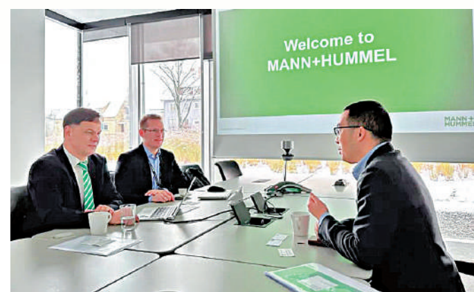
▲在昆山開發區招商小分隊來訪後，德企曼胡默爾表示將推動總投資約3600萬美元的水/空氣過濾項目早日落戶昆山。

自從10月27日江蘇省無錫市首創由政府組織赴境外經貿包機以來，江蘇多地政府爭相跟進，其他一些省市也開始效仿。目前，浙江、廣東、四川等地政府紛紛組團出國招商，希望把「失去的三年」搶回來。