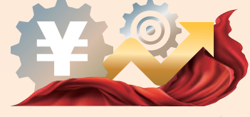
解讀中央經濟工作會議

隨着疫情防控政策調整，內地各省市掀起了一陣組團出境招商引資的風潮。剛剛閉幕的中央經濟工作會議也明確提出，要更大力度吸引和利用外資。對此，受訪者企業和專家認為，面對外資企業加速遷移的趨勢，中國需要從「抓項目」轉向「造環境」，「築巢引鳳」，切實改進投資營商環境，協助企業開拓內銷市場，提振外資企業在華生根發展的信心。