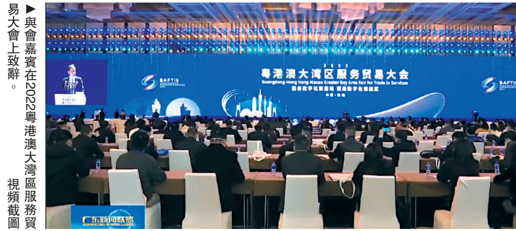
與會嘉賓在2022粵港澳大灣區服務貿易大會上致辭。