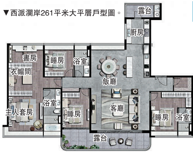
▼西派瀾岸261平米大平層戶型圖。