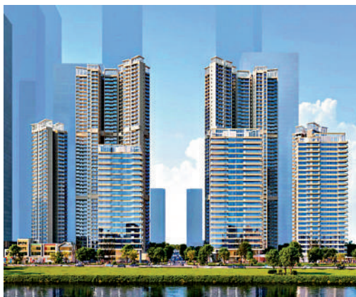
▲西派瀾岸一共規劃7棟住宅和2棟公寓。