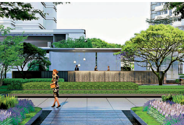
▲西派瀾岸屬於中國鐵建最頂級的「西派系」產品線。

價錢方面，銷售代理透露，2棟單價與周邊持平，大概每平米3.4萬到3.6萬元（人民幣，下同），如建面約125平米南向望江4房，總價大概430萬元。1棟大平層單位由於稀缺，預計單價每平米3.8萬元左右，甚至更高。