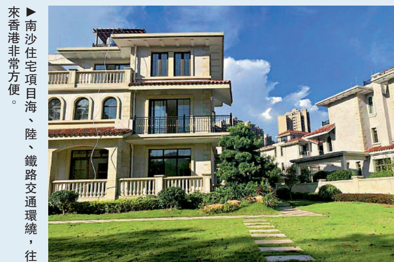
▶南沙住宅項目海、陸、鐵路交通環繞，往來香港非常方便。