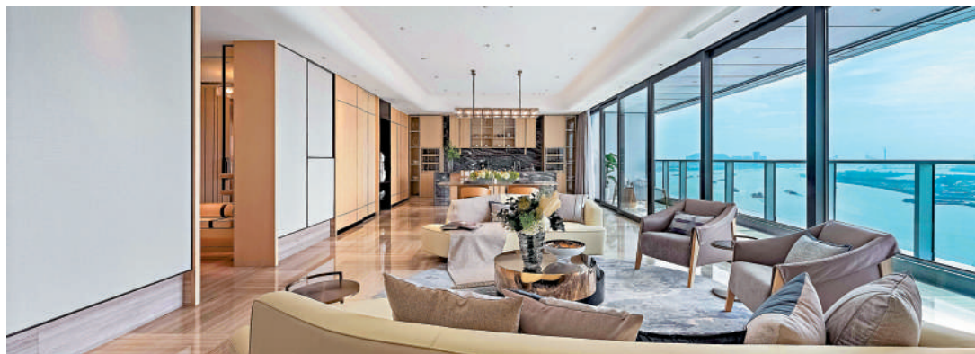
◀位於靈山島尖的越秀明珠灣壹號，是南沙最值得關注的豪宅盤。