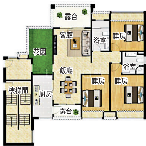
▲南沙灣·御苑122平米戶型圖。

另外，別墅獨立分區安防管理自成一體，確保隱私不受打擾。而目前在售的海景洋房，東面正望寬闊的獅子洋海景，11公里黃金海岸線蜿蜒在旁，可以飽覽海景。記者了解到，南沙灣·御苑的別墅每套1880萬元（人民幣，下同）起。洋房則每平米起步價為2.8萬元，按最小面積計算，每套洋房最少需要341萬元。