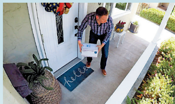
▲「門廊盜賊」偷竊包裹時行動迅速。

在北美地區，快遞員通常會把體積稍大的包裹、郵包等物件放置在收件人地址的門廊處，而毋須簽收。收件人只有在回家或出門時，才會看到門廊處的包裹。許多不法分子盯上了這些無人照看的包裹，化身「門廊盜賊」順手牽羊地將其偷走。