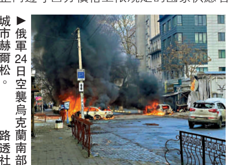
城市赫爾松。俄軍24日空襲烏克蘭南部。路透社

【大公報訊】據路透社報道：面對西方國家對俄石油價格設上限禁令，俄羅斯副總理諾瓦克24日表示，俄羅斯聯邦將禁止向遵守西方價格上限規定的國家供應石