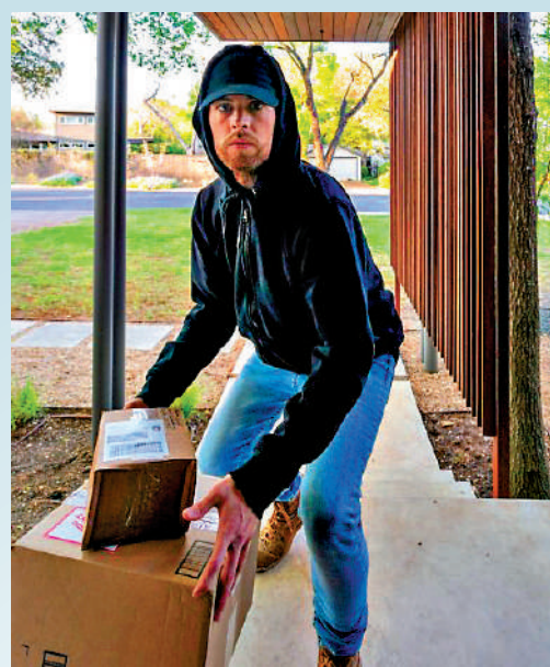
▲美國迎來聖誕禮物季，將有更多包裹被「門廊盜賊」盜竊。

【大公報訊】綜合《紐約郵報》、CNZ 報道：網絡購物如今儼然成為了人們生活中不可或缺的一部分。新冠疫情發生後，「門廊盜賊」愈發猖狂，卻令許多美國人為網上購物而苦惱。據 SafeWise 的一項調查指出，美國今年預計有 2.6 億個包裹在送到收件人的門廊後被偷走，總損失約 195 億美元（約 1511 億港元）。美國人亦各出奇招，對抗這些不法分子。