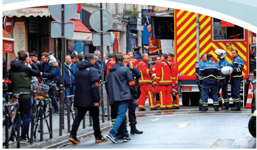
▲法國巴黎中心區23日發生槍擊案，法國警察和消防員封鎖街道。

2011年以約9.9億美元收購新聞平台與研究集團「國家事務局」，並將其改名為「彭博產業集團」。2012年也有消息稱，彭博計劃收購英國著名財經媒體《金融時報》，最終沒有下文，而《金融時報》於2015年由日本經濟新聞社(Nikkei)收購。