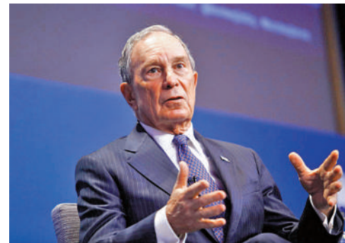
▲美國億萬富翁、前紐約市長彭博。

據悉，貝佐斯2013年以2.5億美元收購的《華郵》今年或將虧損，上周已宣布將在2023年第1季進行裁員。但有《華郵》的發言人表示，「華郵是非賣品」。彭博在