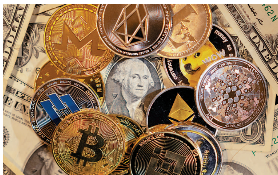
▲加密貨幣今年全面下挫，龍頭比特幣貶值逾六成。