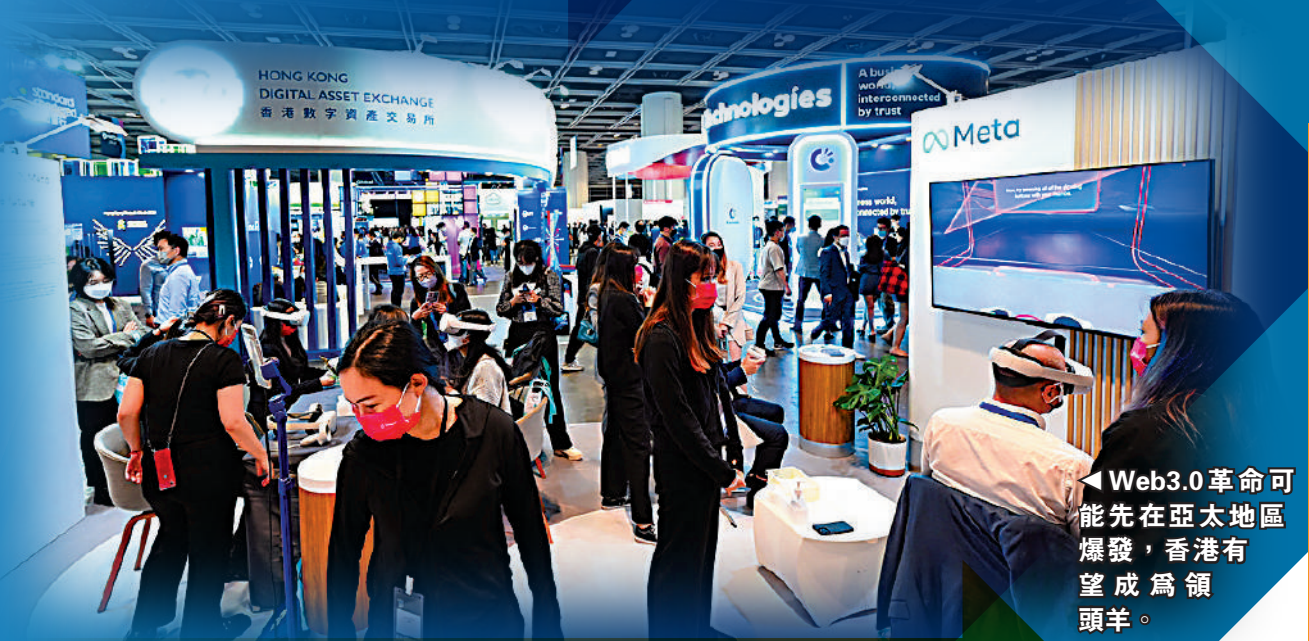
Web3.0革命可能先在亞太地區爆發，香港有望成為領頭羊。