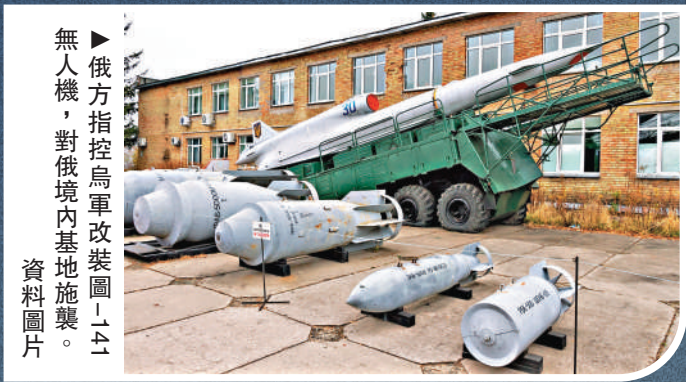
▲俄方指控烏軍改裝圖-141無人機，對俄境內基地施襲。