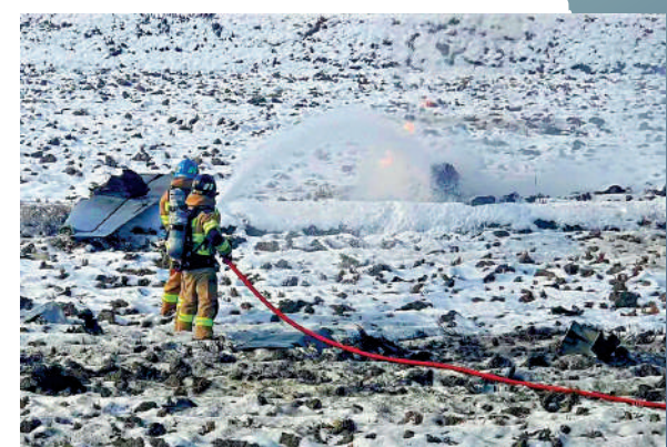
▲韓國一架軍機26日執行應對朝鮮無人機任務時墜毀。

據韓媒報導，這是2017年以來朝鮮無人機首次侵犯韓國領空。作為回應，韓軍在朝韓軍事分界線附近和以北地區投入有人和無人偵查設備，拍攝了朝方主要軍事設施。如此一來，雙方均侵入了《9月平壤共同宣言》設定的空中緩衝區。