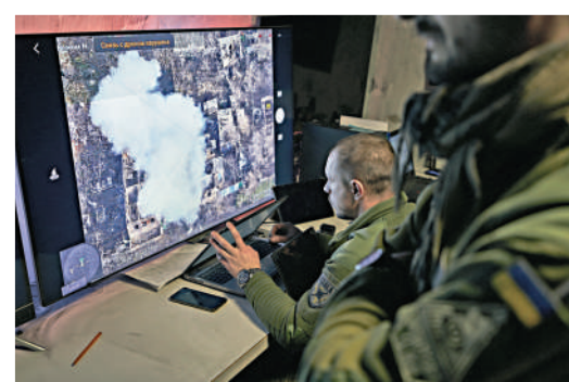
▲烏軍士兵25日在烏東一個指揮中心操作無人機。