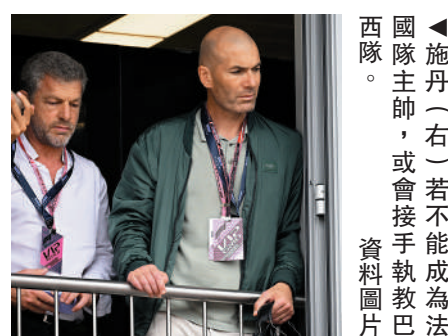
▲施丹（右）若不能成為法國隊主帥，或會接手執教巴西隊。 資料圖片

巴西主帥迪提在世界盃後離任，足總正在加緊物色新主帥，並表示會考慮聘請外籍教練，之前有傳意大利名帥、現執教皇家馬德里的安察洛堤是候選人之一，如今又傳來曾於1998年世盃決賽頂入兩球，助法國以3：0大勝巴西而首奪錦標的施丹有機會繼任，但首先要視乎法國足總會否「成人之美」。法國足總主席格拉透露，將於下周與帶領法國取得世盃亞軍的迪甘斯談續約事宜，足總方面傾向與後者續約，若能成