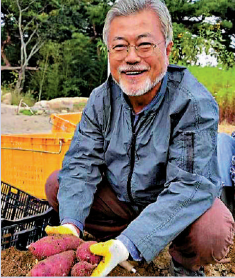
▲文在寅今年5月卸任，在社交媒體分享退休生活片段。