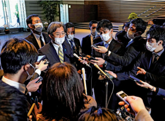
▲捲入醜聞的秋葉賢也27日辭去復興大臣職務。

據共同社介紹，秋葉賢也作為眾院比例代表在東北當選，至今當選7次。他屬於自民黨茂木派，曾在安倍內閣擔任首相助理，今年8月在內閣改組中首次成為閣僚。接替他的渡邊博道現年72歲，2018年10月進入安倍內閣擔任復興大臣。