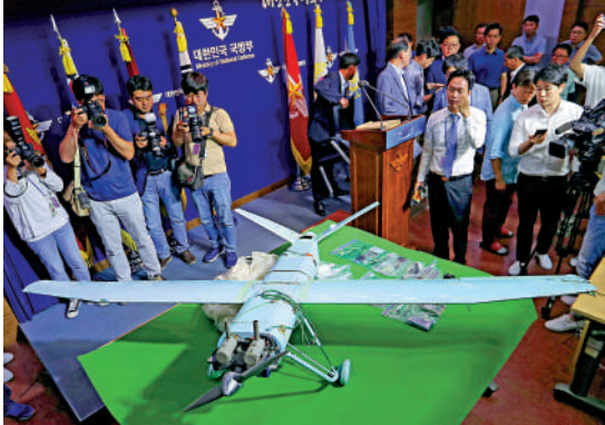
▲韓軍26日面對朝鮮無人機的表現受到批評，圖為2017年韓國國防部展示的疑似朝鮮無人機。

【大公報訊】據韓聯社報道：5架朝鮮無人機26日進入韓國領空，其中1架直接飛往首爾北部地區。消息人士稱，不排除該無人機飛到龍山總統府進行拍攝的可能性。韓國軍方的防空能力因此受到質疑。韓國聯合參謀本部27日就未能擊落朝鮮無人機致歉。