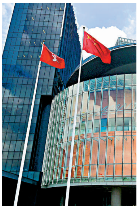
▲本港各界人士認為，人大常委會釋法是香港法制重要而無可取代的組成部分，有助於凝聚社會共識，有利於維護國家安全。資料圖片

十三屆全國人大常委會第三十八次會議27日上午在北京人民大會堂舉行第一次全體會議。會議聽取了國務院港澳事務辦公室主任夏寶龍受國務院委託作的關於提請解釋香港特別行政區維護國家安全法有關條款的議案的說明。