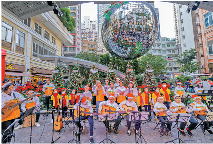
▲「市建童樂·社區樂團」首次夥拍「音樂兒童基金會」，在灣仔利東街合唱「It's A Small World」，用歌聲為社區帶來佳節歡樂的氣氛。

黃元山昨日表示，很榮幸獲得特首的委任，他已辭任立法會議員及在團結香港基金的工作。在香港由治及興這個關鍵時期，他會竭盡所能，在新的崗位努力貢獻過往在政策研究和金融經濟工作的經驗。