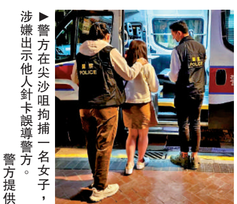
涉嫌出示他人針卡誤導警方一名女子

油麻地分區雜項調查小隊前晚突擊巡查區內的酒吧及餐飲處所，行動期間，警員在一間位於上海街的餐飲處所