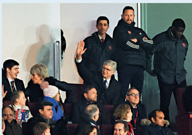
▲雲加（舉手者）入場觀看阿仙奴對韋斯咸的賽事。

卡約沙卡、加比爾馬天尼利和尼基迪亞於下半場的17分鐘內連入3球反勝；阿仙奴主帥阿迪達表示，球員事前並不知雲加回來，亦讚雲加選擇了「拆禮物日」這個好日子回來球會走一走，與故友重聚。