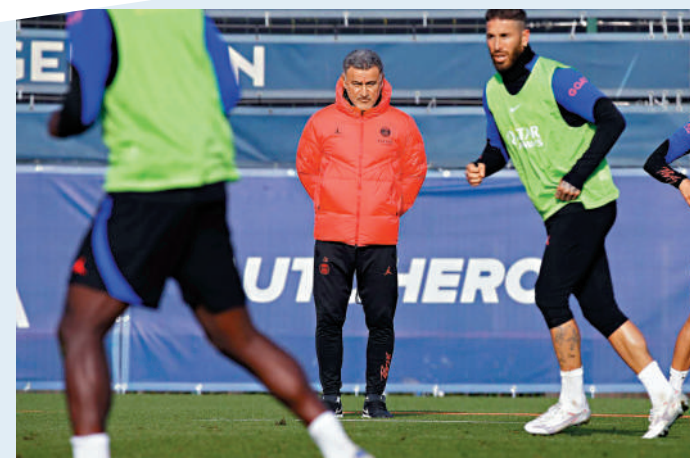
▲聖日耳門主帥加西亞（中）主持球隊操練。