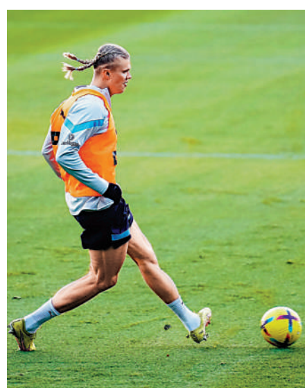
▲艾寧夏蘭特積極備戰對列斯聯的英超賽事。