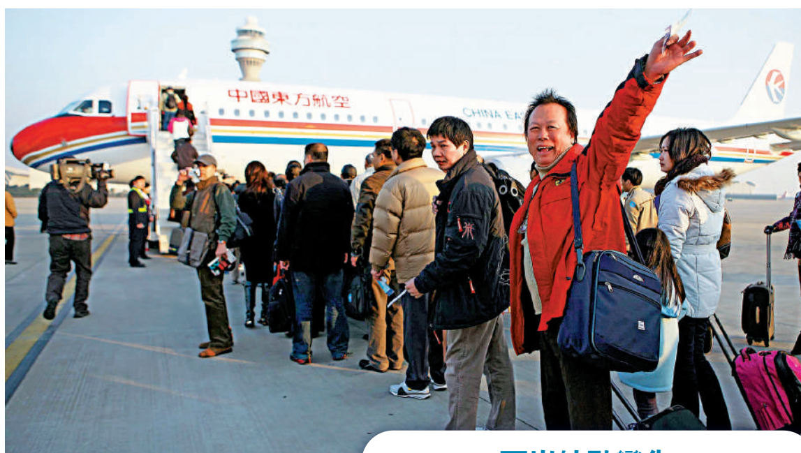
圖為台胞在上海浦東機場登機飛往台灣桃園機場。資料圖片