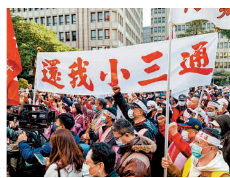
▲24日下午，台灣民眾發起遊行，敦促當局徹底取消限制，恢復完整的「小三通」。

據疫情指揮中心28日通報，台灣本土疫情連續多日升溫，當天新增本土確診病例27942例，較上周同期增加46%。