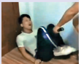
▲受害人在「KK園區」內遭禁錮、虐打。

8月，「KK園區」成為港人關注的熱門新聞。不法分子以高薪招徠，誘騙港人到柬埔寨、泰國等東南亞國家工作，到埠後即被沒收護照，並被禁錮在指定建築物或園區內，強迫他們從事網上賭博、網絡詐騙業務等，業績不