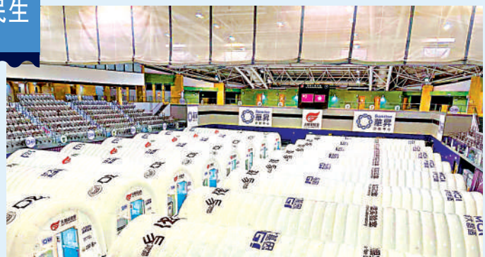
▲第五波來勢洶洶，中央從人力、物力全覆蓋支援香港抗疫，是香港抗擊的堅強後盾。 資料圖片