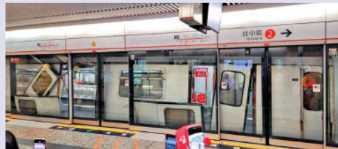
▲11月13日港鐵發生甩門事故，乘客一度要摸黑在隧道逃生。

港鐵荃灣綫油麻地站11月13日發生列車出軌甩門嚴重事故，150名乘客走入路軌，摸黑逃生。乘客行經交叉路軌時「行錯路」，乘客形容驚心動魄。