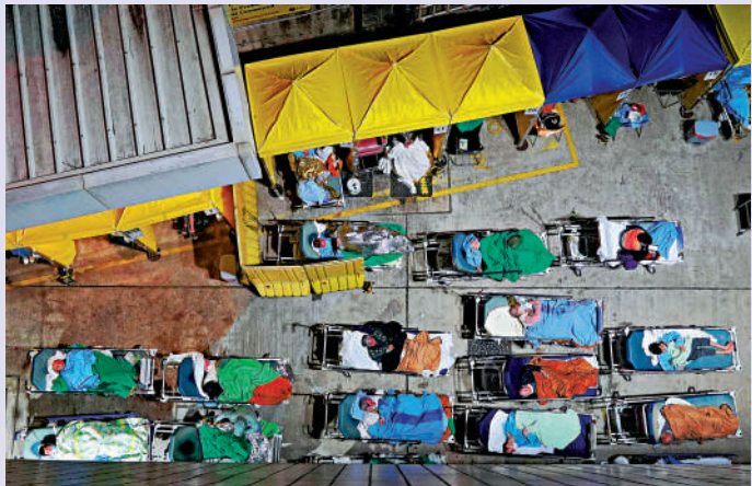
▲今年3月，急症室一床難求，醫院設露天床位，病人在寒風中等待入院一幕，至今歷歷在目。