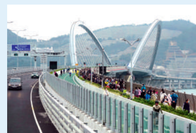
▲將軍澳跨灣大橋同時設有單車徑及行人路。

將藍隧道及連接隧道的將軍澳跨灣大橋在12月11日通車，路段同時設單車徑行人路。將藍隧