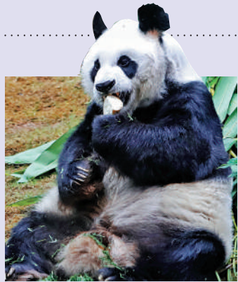
▲「安安」陪伴港人走過二十三載，是全球最長壽的圈養雄性大熊貓。

陪伴港人23載、全球最長壽的圈養雄性大熊貓「安安」，健康情況持續轉差，食量逐漸減少，7月17日開始完全停止進食固體食物，海洋公園在7月21日8時40分為「安安」進行安樂死，「安安」終年35歲，相當於人類的105歲。