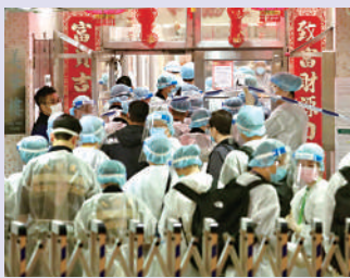
▲疫情之下，圍封強檢的畫面一點也不陌生。

新冠肺炎持續近三年，其中從去年12月爆發延續至今年的第五波疫情，是香港疫情以來最艱難的一役。確診、死亡人數屢創新高，3月初確診人數已由每日三萬多宗，急升至每日五萬多宗，其中3月3日確診宗數多達76991宗，是本港爆發疫情以來單日錄得最高的確診數字。公營醫療體系崩潰，急症室爆滿，病床一位難求，醫院在露天空地設立隔離區，病人冒寒等候。當時死亡人數每日以三位數增加，殮房更出現「屍疊屍」情況。