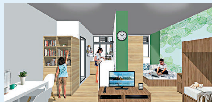
▲政府提出「簡約公屋」新概念，希望加快建屋。 模擬圖片

道全長4.2公里，是連接九龍觀塘區茶果嶺及新界西貢區將軍澳鏡環山東面的公路隧道，其出口接駁1.8公里長的將軍澳跨灣大橋至日出康城一帶。往來將軍澳和東九龍，繁忙時間車程節省20分鐘。