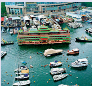
▲珍寶海鮮舫已在西沙群島一帶沉沒。

疫情嚴重打擊經濟，旅遊零售首當其衝。優之良品開業近20年，疫情下生意大受影響，最終在6月6日全線零售店結業。康泰旅行社屹立香港56年，10月尾，康泰旅行社因資不抵債，被母公司「凱撒旅業」清盤，正式步向結業，涉及300名員工。