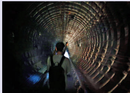
不足一個月，12月5日，將軍澳綫發生列車懷疑脫鉤事故，一列往北角方向的將軍澳綫列車，其接駁第六、七卡車廂的緩衝器故障，車上約1500名乘客需步行往將軍澳站月台疏散。