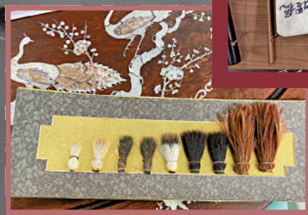
◀製筆業有說：筆之所貴在於毫。毛筆好壞，關鍵是筆頭。