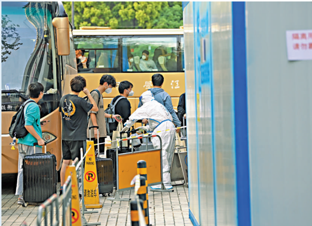
▲在浙江杭州，抵達隔離酒店的隔離人員排隊辦理入住。