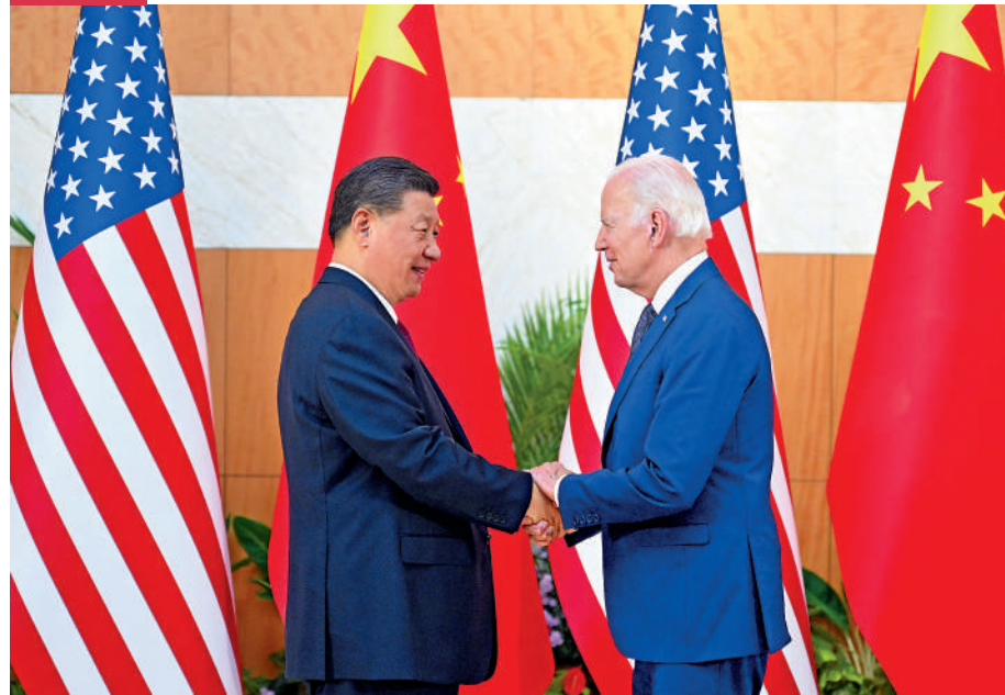
▲當地時間11月14日，中國國家主席習近平在印尼峇里島同美國總統拜登舉行會晤。

11月14日下午，中國國家主席習近平在印尼峇里島同美國總統拜登舉行會晤，就中美關係中的戰略性問題以及重大全球和地區問題坦誠深入交換了看法。兩國元首都認為，會晤是深入坦誠和建設性的，責成兩國工作團隊及時跟進和落實兩國元首達成的重要共識，採取切實行動，推動中美關係重返穩定發展軌道。