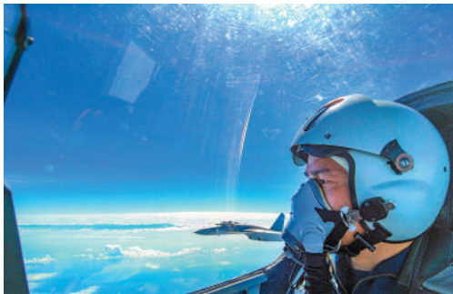
▲8月7日，中國人民解放軍東部戰區按計劃，在台島周邊海空域進行實戰化聯合演訓。新華社

中國人民解放軍高度戒備，8月2日晚開始，解放軍東部戰區陸續在台島周邊開展一系列軍事行動，在台島北部、西南、東南海空域進行聯合海空演訓，在台島海峽進行遠程火力實彈射擊，在台島東部海域組織常導火力試射。8月5日，中國外交部宣布對美國國會眾議長佩洛西實施制裁。