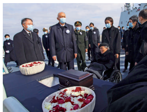
▲12月11日，江澤民同志的骨灰在長江入海口撒入大海。