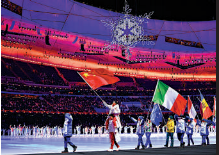
▲2月20日晚，北京第二十四屆冬季奧林匹克運動會閉幕式在國家體育場舉行。

舉世矚目的第二十四屆冬季奧林匹克運動會2月4日至2月20日在北京舉行，第十三屆冬殘奧會也在3月4日至3月13日舉行。從「北京歡迎你」到「一起向未來」，北京成為全球首個成功舉辦奧運會和冬奧會的「雙奧之城」。作為東道主，中國體育代表團共有387人，其中運動員176人，均為歷來最大規模。「冰絲帶」「雪如意」等飽含中國文化魅力的體育場館，「飛貓」等攝像系統助力，18,000多名賽會志願者周到服務、冬奧「閉環」防疫的全力保障、中國首批「滑雪醫生」的使命必達……所有這一切，都共同詮釋了綠色、共享、開放、廉潔的辦奧理念，展現出陽光、富強、開放、充滿希望的中國風貌。