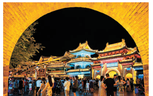
▲12月7日，國務院發布「新十條」優化疫情防控。圖為遊客暢玩西安。

繼11月10日推出優化防疫措施「二十條」後，國務院聯防聯控機制綜合組12月7日再推出「新十條」優化防控措施，要求各地不得採取各種形式的臨時封控等。中國內地疫情防控工作重心自此從防控感染轉到醫療救治上。12月26日，國家衛健委發布公告，明確將新型冠狀病毒肺炎更名為新型冠狀病毒感染。自2023年1月8日起，優化中外人員往來管理，來華人員在行前48小時進行核酸檢測，取消入境後全員核酸檢測和集中隔離等。