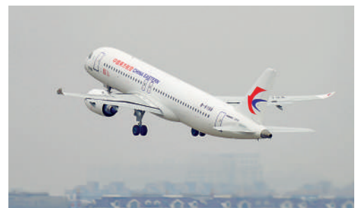
▲12月26日，交付東航的C919在上海前往北京，開展100小時驗證飛行。

12月9日，首架商飛C919正式交付給中國東方航空，而在交付儀式上，中國民航局正式向C919頒發適航許可證。C919是中國首架自主研发並獲得適航許可證的飛機，通過了所有適航審定，符合適航要求投入商業航班運作。中國成為第四個具備自主研製大型民用客機的國家及經濟體，圓了中國自運十以來的大飛機之夢。