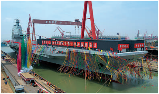
▲6月17日，我國第三艘航空母艦下水命名儀式在中國船舶集團有限公司江南造船廠舉行。

用平直通長飛行甲板，配置電磁彈射和阻攔裝置，滿載排水量8萬餘噸。「福建艦」令中國一躍跨入到重型航母時代，同時由於其沒有使用傳統的蒸汽彈射技術，首次採用了電磁彈射系統，實現了零的突破和技術的跨越，也令中國繼美國之後成為全球第二個擁有彈射型航母的國家。專家指出，電磁彈射技術為搭載更多機型的艦載機提供了可能性。