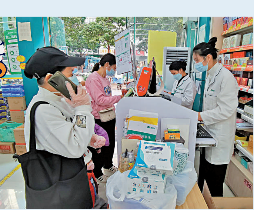
▲大批抗原檢測試劑盒送交藥房，店員點收。

伴隨防疫政策快速調整，北京、上海、廣州、深圳等城市感染人數攀升，快速抗原測試及藥物市場需求明顯增加。香港與內地的香港市民了解。