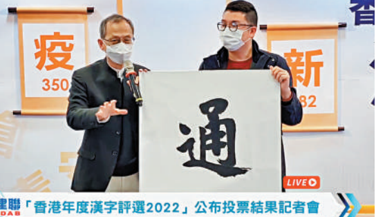
民建聯昨日公布，「通」字得票最多，當選年度漢字。是次有2749名市民參與投票，749人選擇「通」字，寓意通關、暢通。