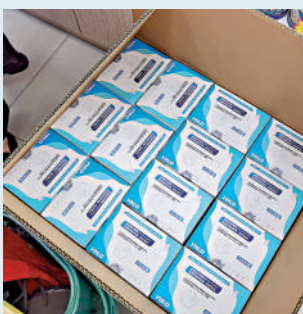
▲新一批抗原檢測試劑盒剛到貨。

店東：非靠此盈利 不擔心貨源 程先生又說，抗原試劑今年以來並沒有給藥房帶來過多少盈利。最初進價是2至3元一人份。之後上海疫情爆發，政府採取免費派送的方式，因此沒有人會過來自己購買。今年6月後，上海全面恢復正常生產生活秩序，抗原需求量和進價都全面提高，一般在7元左右一人份，之後大概加價2元出售。他們一般都從經銷商處進貨，一次進貨1000至2000份，銷量並不大。而進入本輪疫情以後，基本也是這個售價。程先生說，「因為並不靠抗原盈利，所以也並不擔心貨源。」 在記者採訪到的幾家藥房，情況大致相若。不過，隨着各抗原廠商加快生產，在外賣平台和淘寶京東的線上平台，抗原已經陸續顯示有貨狀態。