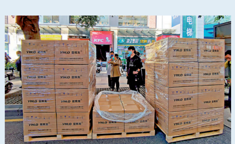
▲在深圳藥房，市民打電話通知朋友來購買抗原檢測試劑盒。

連日來，大公報記者走訪發現，深圳中聯大藥房、南北藥行等絕大多數藥店仍沒有抗原檢測試劑盒售賣，海王星辰等少數能買到的藥店則實行拆零銷售，顧客須憑身份證購買，每人限購5支，單支價格在5.9元。