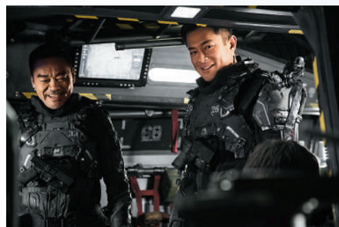
▲《明日戰記》由古天樂（右）、劉青雲主演。

張敬軒5月重開因為疫情押後舉行的「The Next 20演唱會」，12月至明年1月又舉行共11場的「Revisit張敬軒演唱會」，一年內兩度開騷（註：張敬軒12月27日宣布初步確診新冠病毒感染，原定12月27日至2023年1月2日共五場演出將延期舉行）。而張敬軒、陳奕迅、鄭伊健、MIRROR的演唱會，都掀起一股搶飛熱潮，票價更被炒高。為此，部分歌手的演唱會採用實名制購票方式，希望遏止炒風。