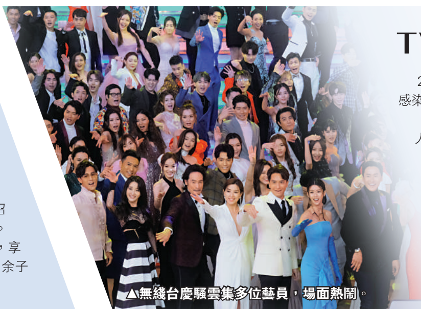
▲無線台慶雲集多位藝員，場面熱鬧。