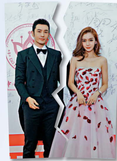
▲黃曉明（左）與楊穎六年婚姻告終。

另外，42歲的莊錫敏（前名：莊思敏）與台灣珍珠奶茶店老闆楊秉逸結婚兩年多；11月，莊錫敏宣布離婚，並透露離婚的最大原因是男方拒絕她赴內地、香港發展。