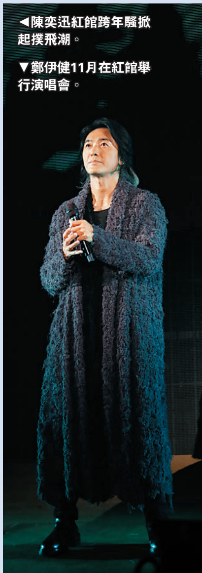
◀陳奕迅紅館跨年騷掀起撲飛潮。 ▼鄭伊健11月在紅館舉行演唱會。