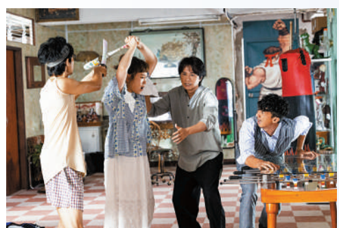
▲《飯戲攻心》票房口碑俱佳。