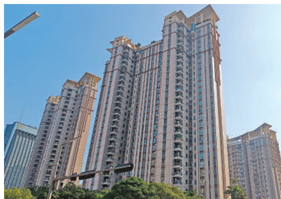
▲雅頌居樓齡雖18年，但保養完善，外觀簇新。