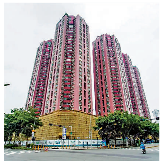
▶中銀花園為綜合式項目，5幢住宅樓高32層，提供1018個單位。