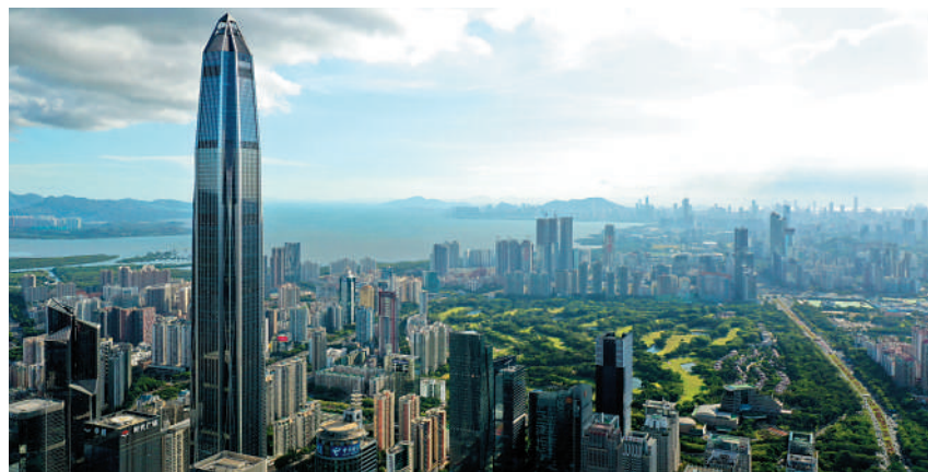
▲深圳福田中央商務區甲級商廈林立，住宅物業受用家追捧。