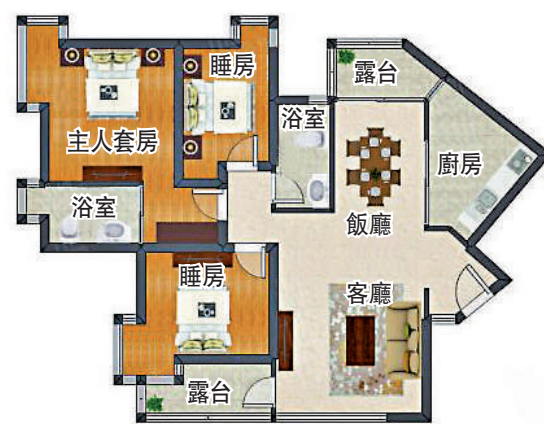
▲天健世紀花園117平米三房兩廳戶型圖。