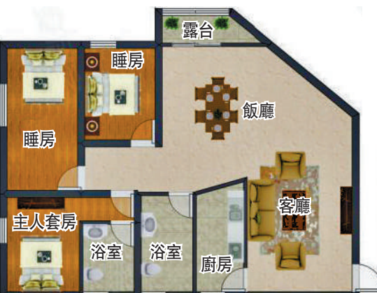
▲中銀花園99平米三房兩廳戶型圖。