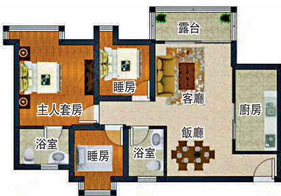
▲深業花園95平米三房兩廳戶型圖。