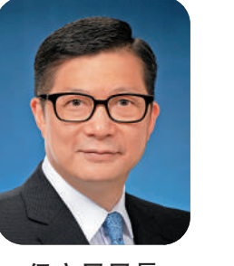
保安局局長 鄧炳強

踏入新的一年，我很高興與香港在疫境中逐步復常，而香港市民期待已久的通關很快將可實現。我會帶領相關紀律部隊做好準備，確保通關能有序進行，各出入境管制站運作暢順。 展望新的一年，我祝願香港繁榮進步，百業興旺，社會穩定和諧，市民事事如意，家庭幸福愉快。我和保安局同事及轄下紀律部隊會致力維護國家安全，使香港繼續成為世界上最安全的城市之一，令市民在一個安全和穩定的環境下安居樂業，香港得以持續發展。