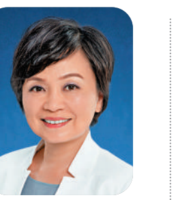
教育局局長 蔡若蓮

光陰荏苒，轉眼間，我們走過了2022，迎來了新的一年！ 回顧過去，我們充滿感恩。感謝專業教育團隊的辛勤付出，克服了疫情的挑戰，守護了同學的健康，照顧了不同的學習需要，校園生活正逐步有序恢復。在大家共同努力下，我們積極把握國家發展的機遇以及「科教興國」的策略，以「立德樹人」為目標，致力培養同學成為德才兼備、有承擔、有視野、愛國愛家的終身學習者，努力「讓孩子的教育更好一些」。 「長風破浪會有時，直掛雲帆濟滄海」。新的一年，教育局會繼續配合國家和全球發展大勢，以香港整體發展藍圖和方向為本，不忘教育初心，牢記育人使命，擔當作為，為年輕一代的成長成才創造更多機會。深信在大家協同努力下，香港教育定必更加美好。