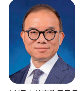
政制及內地事務局局長 曾國衛

2022是極不平凡的一年。5月，新任行政長官高票當選；7月，在習主席的見證下，新一屆特區政府上任就職並共同慶祝特區成立25周年；10月，行政長官發表首份施政報告，充分展示「以結果為目標」的新思維；同月，中國共產黨第二十次全國代表大會在北京隆重召開；然而12月，前國家主席江澤民逝世，舉國沉痛哀悼；至11月，在國家長期醫治嚴防嚴控之下，新冠病毒終於減弱，而萬眾期待的復常及通關之路終可邁步向前頭。 在行政長官的帶領下，特區各界團結一致，香港的前景必定如習主席所說大有可為，風光無限！讓我們一起奮鬥努力，共同創造美好的2023年！