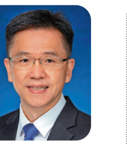
創新科技及工業局局長 孫東

在新的一年，我祝願國家國泰民安，全港市民新年進步！《香港創新科技發展藍圖》為香港未來的創科發展勾畫出清晰的發展路向和重點策略，我們將循《藍圖》中的四大發展方向及八大策略落實更多具體的執行方案，使香港創科發展實現新的飛躍。在國家的大力支持下，只要全社會上下一心、群策群力，共同為香港的創科發展出謀獻策，積極發揮香港自身優勢，增強發展動能，擁抱國家為我們所帶來的機遇，定能逐步落實中央冀盼香港建設成國際創科中心的偉大願景，提高市民生活質素及促進社會經濟繁榮發展。香港的未來將充滿無限曙光！