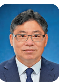
運輸及物流局局長 林世雄

2022年對我和同事而言別具意義，除了是香港回歸祖國25周年，亦是香港特別行政區第六屆政府開局和運輸及物流局成立之年。 面對環球疫情持續帶來挑戰，政府和相關團隊一直緊守崗位。看到東鐵綫過海段、將藍隧通、將軍澳跨灣大橋通車大大便利市民出行；機場第三條跑道啟用獲機師盛讚；粵港跨境貨車恢復「點對點」運輸為業界和整體經濟帶來裨益等，令我和同事覺得再艱苦的籌備和協商過程都是值得的。 踏入新一年，我們會繼續按「基建先行」及「創造容量」的規劃方針全速推動運輸基礎建設，加強與大灣區城市的跨界融合，完善運輸網絡。我們亦會全力推展機場三跑道系統，不斷提升香港作為國際航空樞紐和國際航空中心的地位，致力令施政成果惠及全港市民。