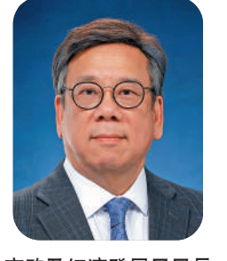
商務及經濟發展局局長 丘應樺

2022年，是別具意義的一年，香港回歸祖國25周年，充分體現「一國兩制」的成功落實，我亦有幸成為新一屆特區政府的一分子，為香港、為國家服務。過去一年，即使面對地緣政治和疫情等挑戰，香港憑藉「背靠祖國 聯通世界」的獨特地位和優勢，仍是全球最具競爭力的經濟體之一。隨着防疫和入境措施放寬，多項國際盛事和會議順利舉行，向世界展示香港復常、經濟發展重拾動力。展望來年，我們會致力說好香港故事、發揮香港所長和融入國家發展大局，亦必須鞏固優勢，透過主動進取的措施「搶企業」、「搶人才」，便利有意來港投資的重點企業把握香港的機遇，達至雙贏。同時，我們會繼續支援中小企業，促進便利營商的環境，攜手迎接新景象、新挑戰。 我祝願各位市民身心康泰、工商百業興旺！