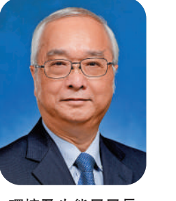
環境及生態局局長 謝展寰

一元復始，萬象更新。值此元旦之際，環境及生態局謹向每位努力融合生態發展大局，達至「雙碳」目標及竭力維持環境衛生的香港市民、業界友人送上真摯的問候與祝福。 受疫情的影響，對很多人來說2022年是艱難的一年。迎向全面復常的新一年，環境及生態局繼續推進「淨零發電」、「節能綠建」、「綠色運輸」和「全民減廢」四大減碳策略，致力帶領香港於2050年前實現碳中和。 寄望2023年與各界通力合作，做到少一點浪費耗能，多一點節約節能；少一點環境污染，多一點綠色生態。祝願人與自然和諧共融共生，香港環境衛生亦展開新篇章。