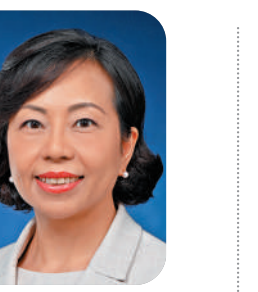
民政及青年事務局局長 麥美娟

踏入2023年，我衷心祝願全港市民家庭幸福、身體健康、平安快樂！ 剛過去的一年對香港來說可謂別具意義，既是香港回歸祖國25周年的大日子，亦是國家和香港發展的重要里程碑。香港在國家鼎力支持下不斷邁步向前，融入國家發展大局，現已踏入「由治及興」的新階段。民政及青年事務局剛公布了首個版本的《青年發展藍圖》，這是特區政府首次為推動青年發展而制訂的重要文件，為未來的青年工作定調、定向、定量和定速。展望來年，民青局將繼續與社會各界攜手合作，落實《藍圖》提出的一系列行動和措施，致力提供有利環境，讓年輕一代對未來抱有盼望，自強不息。