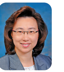
公務員事務局局長 楊何蓓茵

祝各位市民、大公報的讀者新年進步、身體健康！2023年是香港謀發展的好年。公務員事務局新一年的工作重點，是優化公務員隊伍的人事管理和提升培訓的質和量。首季將會推出更新版《公務員守則》草擬本作諮詢，而動員機制在增設「全政府動員」級別後亦會進行首次演練。去年，我們克服了一個又一個難題；2023年，我會繼續與公務員團隊攜手並肩，團結一致，支持行政長官施政，竭誠為市民服務，穩中求進，為香港譜寫新篇章。