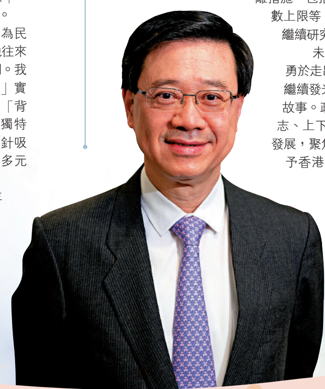
祝願新一年市民安康、百業暢旺！

為了促進本港復常，特區政府近日亦進一步優化防疫措施，取消「檢疫令」及不再界定密切接觸者，取消「疫苗通行證」，取消所有入境強制核酸檢測，以及取消絕大部分社交距離措施，包括「限聚令」、餐廳距離和每台人數上限等。特區政府會密切留意疫情發展，繼續研究優化措施，推動全面復常。 未來一年，特區政府會帶領香港，勇於走出疫情陰霾、撥開雲霧，帶領香港繼續發光發亮，向全球傳揚我們的真實好故事。政府管治團隊及公務員隊伍專心致志、上下同欲，為市民謀幸福，為香港謀發展，聚焦三方面工作，包括把握經國家賦予香港的機遇，更積極融入國家發展大局；把握好「一國兩制」獨特優勢所帶來的機遇，再加強與國際的密切聯繫；吸引和培育人才，推動青年發展，確保發展及競爭力不斷強大。 在新時代新征程上，香港將大有可為，風光無限！