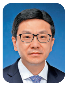
勞工及福利局局長 孫玉茜

踏入2023年，在此恭祝大家新年快樂。回首過去一年，縱使疫情持續，但勞工市場繼續改善，失業率逐步下跌至最新的3.7%。經過多日的諮詢和討論，取消強積金對沖安排於六月中提交立法會通過，加強僱員退休保障；然而2022年發生了多宗大型致命工業意外，令人痛心惋惜。展望新一年，除了正待立法會審議的職安健條例修訂草案和院舍條例修訂草案，我們亦會就制定舉報虐兒個案機制提交條例草案，期望能夠制定到位的政策，做到習近平總書記所說的「勞有所得」、「老有所養」、「弱有所扶」，提升市民的獲得感、幸福感和安全感。 最後，我衷心祝願祖國繁榮富強！香港特區風調雨順！大家生活幸福，身體安康！