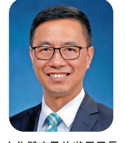
文化體育及旅遊局局長 楊潤雄

恭祝全香港市民新年進步，身體健康！ 2023年三不盡、六六無窮，迎來充滿生機的一年。 國家《十四五規劃綱要》將香港定位為中外文化藝術交流中心，文化體育及旅遊局定會把握二十大帶來的新機遇，說好中國故事、香港故事。2023年我們會做好與不同地方的交流工作，將香港優勢展現於世界舞臺。 另外，我們更是滿有新歡，體育和文化藝術盛事一浪接一浪，以求讓文體旅真正走進每一位香港市民的生活裏，為大家帶來快樂感、幸福感和自豪感。 在復常這條道路上，我們已看見曙光，旅遊發展局亦已經準備好推出新的宣傳攻勢，務求來年旅遊業可以真正復甦。