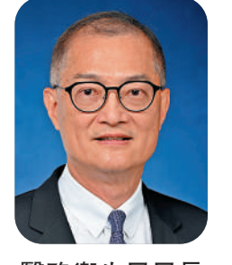
醫務衛生局局長 盧寵茂

2022年出任醫務衛生局局長時，我立下三大使命：第一，加強防疫，為香港連接國際，連通內地。第二，優化醫療，令市民病有良醫；公私營醫療提供全方位服務，不單要增量，更要提質增效。第三，創出香港，為業界引領大灣區，要充分發揮香港在醫療衛生技術及管理 and 生物醫藥科研各方面的優勢，推動大灣區醫療創新和融合。 抗擊新冠疫情是醫務衛生局重中之重的任務，上任之初，我們很快理順了入境檢測流程、優化核酸檢測配套等。隨着疫情發展，我們按照科學數據分析，適度調整防疫措施。通關在即，醫務衛生局必定會確保公營醫療系統可以持續有效運作。 回顧我的三個使命，香港已連通國際，亦快將連通內地。我會繼續全力推動第二及第三個使命。我深信在醫務衛生局、衛生署和醫院管理局同事們齊心推動下，我們必定可克服各項挑戰，締造「健康香港」。2023年，香港滿活力、市民更健康！