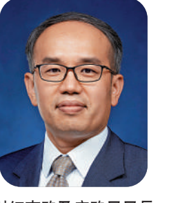
財經事務及庫務局局長 許正宇

儘管香港經濟在2022年受疫情、地緣政治及環球高息影響，但憑藉國家的堅定支持和香港獨有優勢的韌性，我深信最壞的時間已過。年內香港慶祝回歸祖國25周年，中共二十大勝利舉行；而自10月底開始各式國際盛事接踵而至，讓全世界知道「香港回來了」。 展望2023年，在「一國兩制」下的新征程上，香港將持續擴大離岸人民幣業務中心的地位，推進更多互聯互通方案，並強化資產及財富管理業務，推動家族辦公室在港設立或擴展；加上中央近日同意香港和內地逐步、有序、全面通關，讓香港和內地得以恢復經濟和人文交流，香港在新一年定當大有可為，風光無限！在此我祝願大公報讀者事事順遂、身體健康！