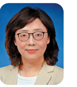
發展局局長 甯漢豪

本屆政府上任之後，從「提量、提速、提效、提質」四個方向，採取多管齊下的土地發展策略，壓縮地地程序，長遠建立土地儲備，以提供足夠土地支持社會各方面的需要，既為解決「住」的問題，亦為提升市民生活質素和增強香港的發展動能。發展局正全力推進有關工作，期望新的一年繼續與各界攜手協力，把各項政策落實到落處，切實緩解民生憂難，構建一個更宜居、有發展動力的香港。新年伊始，我祝願國家國泰民安、香港飛躍向前，全港市民身心康泰！