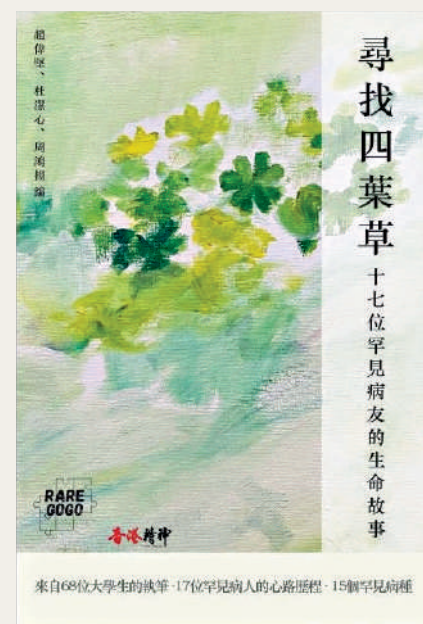
▲《尋找四葉草》是中大學義工為十七名罕見病患者撰寫一本自傳式生命故事集，希望幫助大眾認識、理解罕見病患者，讓更多的人樂意對罕見病患者伸出援手。

但是作者們青澀的文筆也不妨礙我們在閱讀時，收穫感動，收穫精神上的鼓舞。在這個世界上，如果我們每個人，都能用愛心關注弱勢群體，激發他們找到生命中的四葉草，這個世界該是多麼的溫暖。