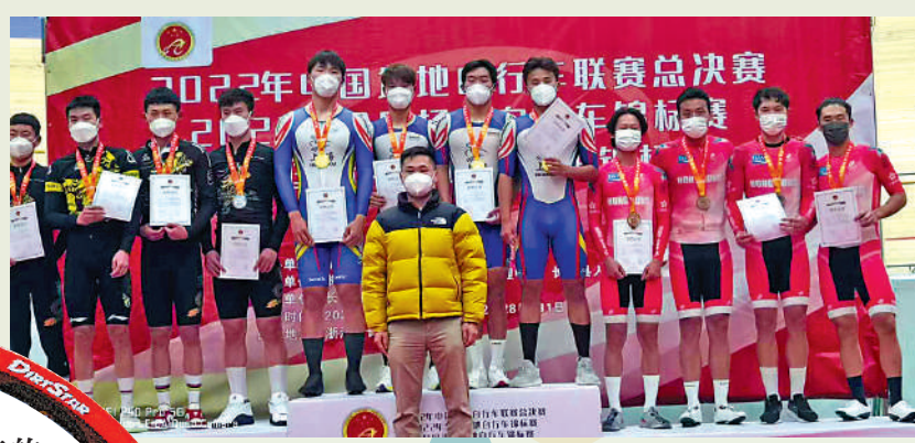
▲香港男隊（右四人）在團體追逐賽獲得銅牌。