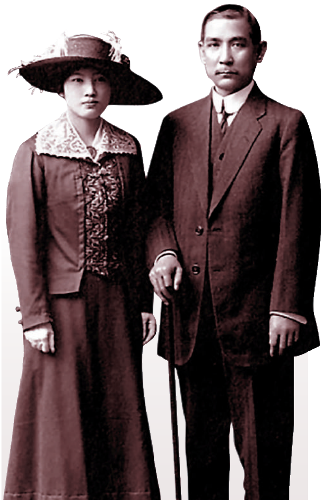
▲「孫中山宋慶齡與香港」歷史圖片展在香港開幕。