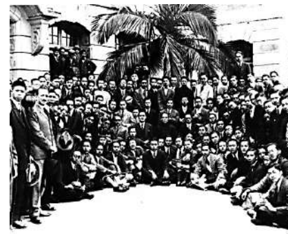
▲孫中山與香港大學師生合影。

孫中山於1887至1892年就讀香港西醫書院，後者於1912年併入香港大學成為醫學院。1923年2月20日孫中山訪問香港大學，在「大禮堂」（現稱陸佑堂）公開演說，當中曾提及「香港與香港大學是我的知識誕生地」。