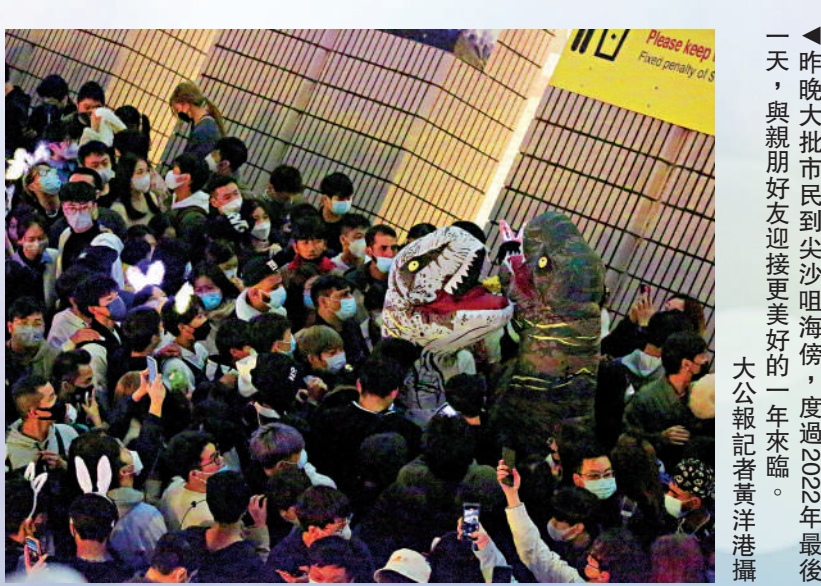
▲昨晚大批市民到尖沙咀海傍，度過2022年最後一天，與親朋好友迎接更美好的新的一年來臨。