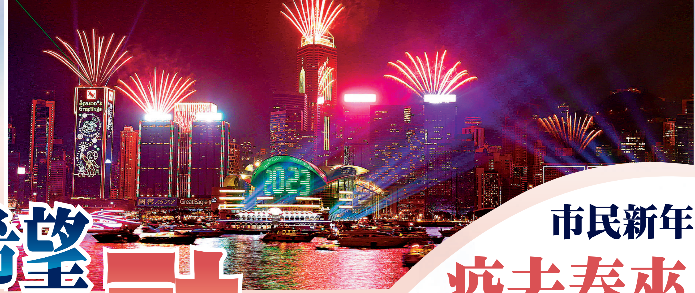
▲維港昨晚舉辦跨年煙火匯演，市民盡情倒數，盼望新的一年更美好。