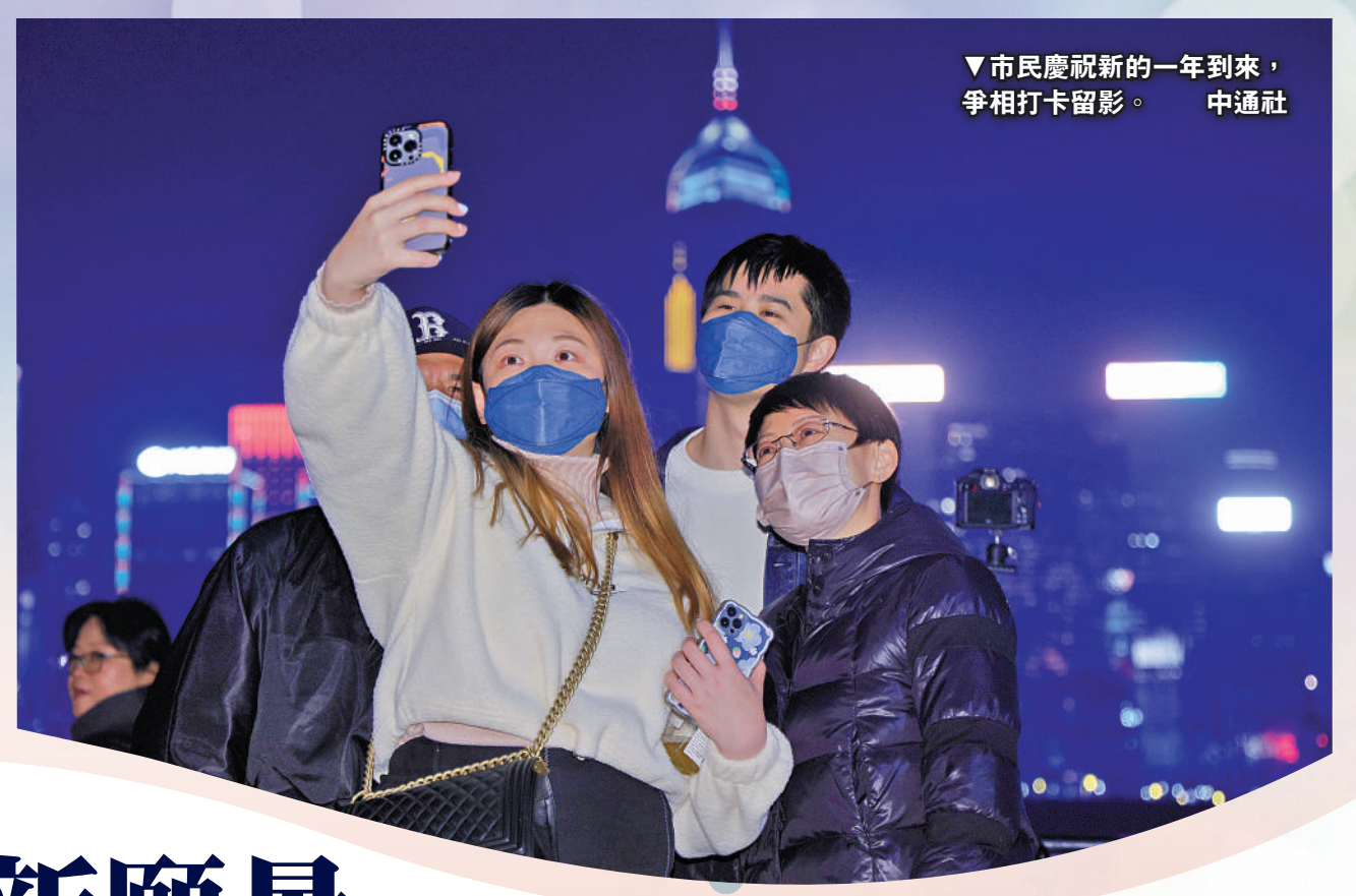
▼市民慶祝新的一年到來，爭相打卡留影。