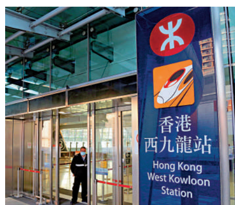
▲港鐵已就通關做好準備，高鐵西九站將會恢復服務。

據了解，港鐵正在全速準備通關，包括在跨境口岸車站進行不同演練，安排相關人員返回原來崗位接受培訓，並檢查車站設施等，確保一切運作暢順。