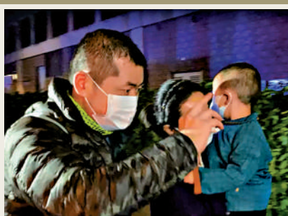
▲巴士翻側後多人被拋跌車廂內，一名男童受驚過度。