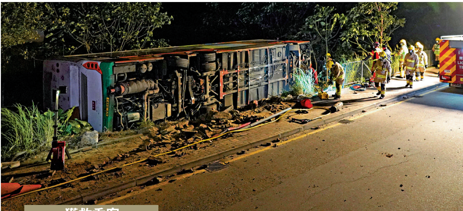
▶將軍澳康城路有巴士翻側在路邊草叢，消防坍塌搜救專隊出動救援。