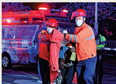
▲消防救護人員救出傷者後協助前往安全地方。