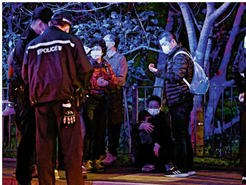
▲警方在現場協助被救出的乘客登記。