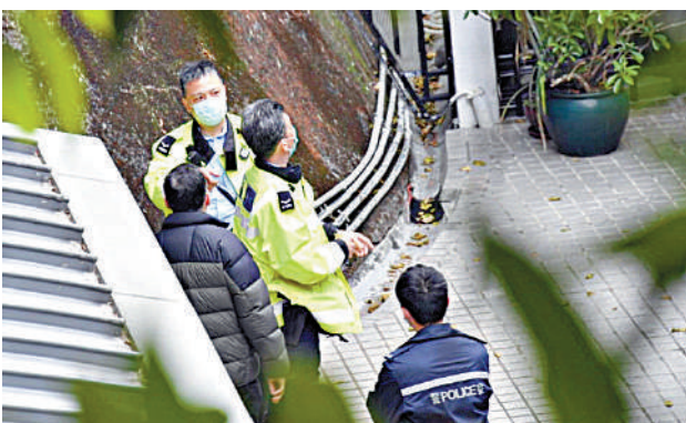
▲警員在事發獨立屋山頂邊巡查。