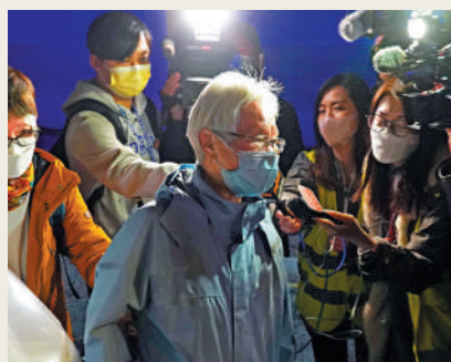
▲有乘客表示當時巴士駛出迴旋處後車速不算快，翻側後要爬上來才能脫險。