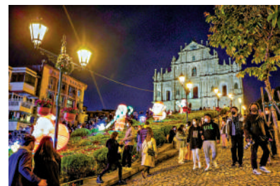
▲澳門旅遊局全力推廣吸引旅客來澳過節度假。