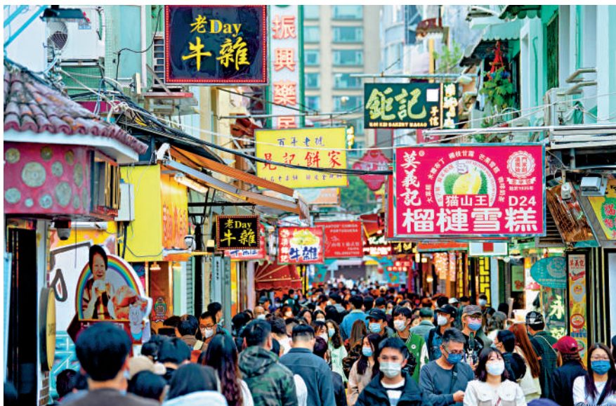
▲2023年1月1日元旦假期，澳門中區人來人往，市面暢旺。不少旅客來澳門跨年，感受節日氣氛。圖為旅客在澳門官也街選購小食。

據了解，港澳旅遊業界目前都致力研發新產品引客延留。澳門業界積極推出以美食、歷史文化探索、休閒度假為主題的產品，及「優質酒店住宿+餐飲+娛樂」套票，目的是讓旅客深度體驗本地旅遊元素，延長旅客逗留時間。