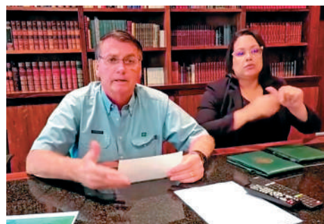
▲博索納羅在卸任前赴美，但依然可能被巴西檢方追責。

2021年8月，巴西聯邦最高法院宣布啟動對博索納羅否定電子投票安全性、散布關於大選消息言行的調查。2022年10月大選結果出爐後，博索納羅還煽動支持者示威，在巴西引發一系列混亂。博索納羅在任期間並未因此受到指控，但如今可能被「秋後算賬」。