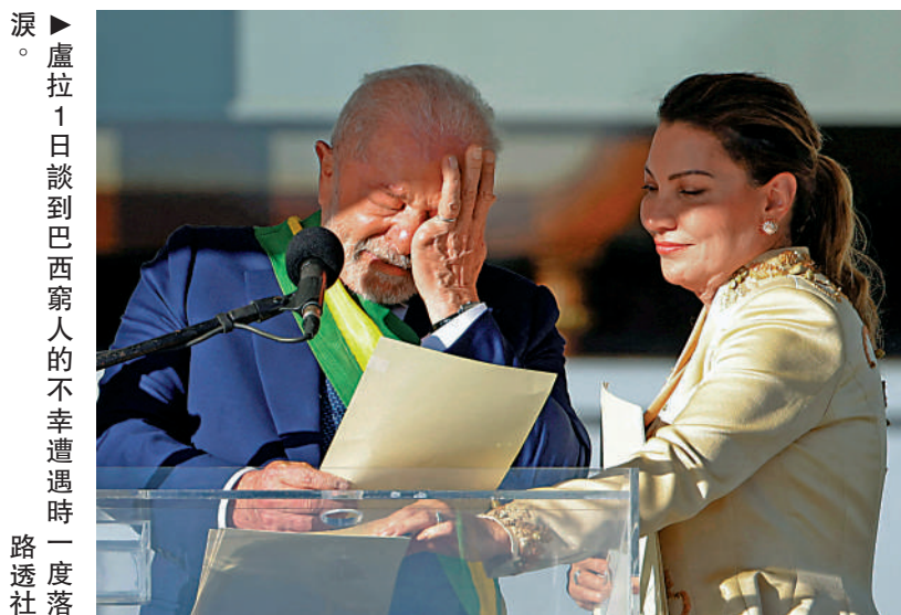
▲盧拉1日談到巴西窮人的不幸遭遇時一度落淚。

【大公報訊】綜合法新社、《日本經濟新聞》、《衛報》報道：當地時間1日，巴西左翼勞工黨領袖盧拉在首都巴西利亞宣誓就任總統，這是他第三度出任巴西總統。盧拉在就職演說中強調，新政府將致力於「團結與重建」，解決當前巴西在經濟民生、環保、外交等領域面臨的多重挑戰。他強調將推動多邊外交，積極發展與中國、美國、歐盟等國際夥伴的合作關係，加強南方共同市場、金磚國家等多邊機制的的作用。