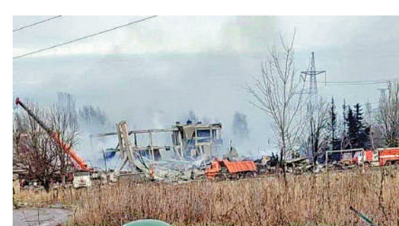
▲位於頓涅茨克的一個俄軍部署點跨年夜遇襲，死傷慘重。

俄軍死亡人數多達數百人。俄國防部說，共有63人死亡。一名俄羅斯任命的官員匿名爆料稱，部署點被烏軍鎖定是因為很多俄軍在那裏使用手機。俄羅斯前情報官員、軍事博主伊