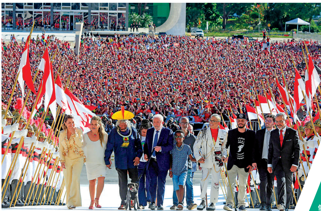
▲盧拉（左四）1日正式成為巴西新任總統。